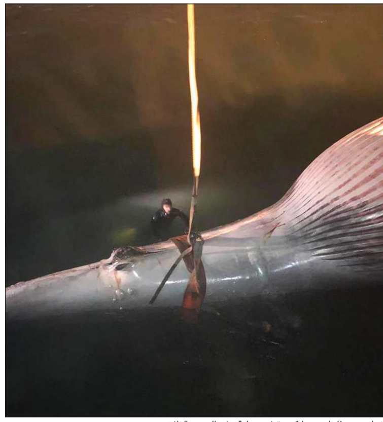
الغواصون بذلوا جهودا كبيرة في عملية رفع الحوت النافق