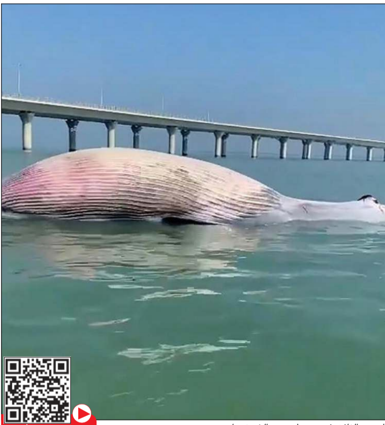
الحوت النافق في محيط جسر الشيخ جابر

تكاتف بين البيئة والموائى والبلدية والزراعة وخفر السواحل وفرق العمليات والغواصين للتعامل معه رفع الحوت النافق من ميناء الشويخ بعد سحبه من محيط جسر جابر