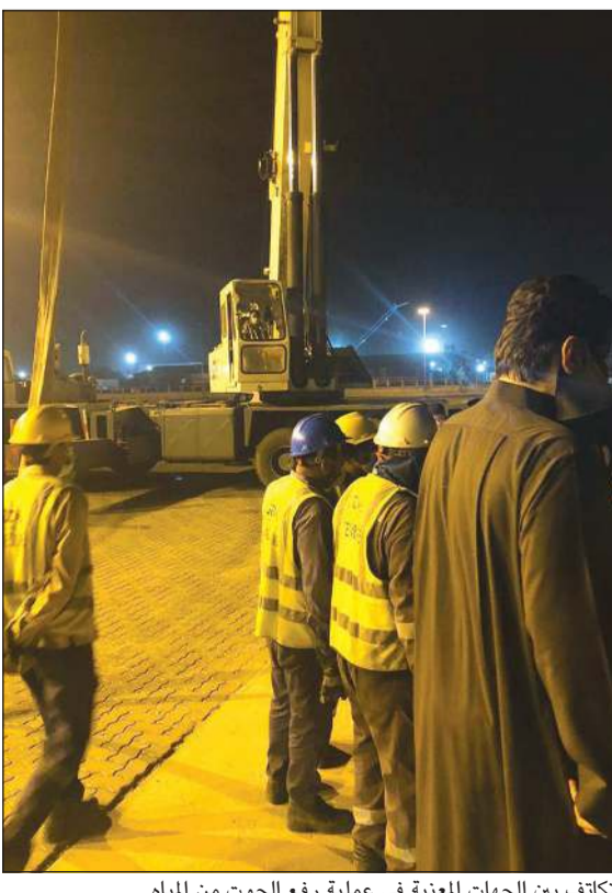
تكاتف بين الجهات المعنية في عملية رفع الحوت من الميناء

العنزي لـ «الأنباء»: عملية سحب ورفع الحوت النافق لم تكن سهلة لأن طوله أكثر من 35 قدماً ووزنه لا يقل عن 10 أطنان خريبط لـ «الأنباء»: عدة فرضيات وراء نفوق الحوت منها أن يكون مريضاً أو جرفته تيارات المياه أو لديه مشاكل في التهوية أو بحثه عن الطعام في المناطق الداخلية ما دفع هذا الحوت للتوجه نحو السواحل التي تتميز بوفرة الكائنات البحرية. وأوضح أن الأسلحة البحرية الكبيرة ممكن أن تضلل الحيتان وتضيق طريقها وبالتالي تدخل المناطق الساحلية دون أن تدرك ذلك كما أن تغير درجة حرارة مياه البحر بطريقة لا تتحملها هذه الكائنات يؤثر عليها أيضاً. ولفت إلى أن للحيتان نظاماً خاصاً يوجهها في طريقها، لكن ربما لم يعمل blowhole وهي المسؤولة عن التهوية لديه وعند دخوله منطقة ضحلة يصعب خروجه منها ما يؤدي إلى نفوقه وحول تحلل هذه الحيتان في المياه، قال الفرصيات أنه يكون مريضاً بعدوى معينة أو مشكلة في فتحة التهوية العليا وحينما يدخل إلى المناطق الضحلة يصعب خروجه منها ما يؤدي إلى نفوقه وحول تحلل هذه الحيتان في المياه، قال