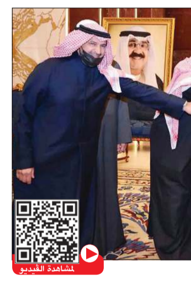
الشيخ د. أحمد ناصر المحمد يشارك الجارالله والحضور قطع كعكة الاحتفال

على دعمهما المستمر لوزارة الخارجية وللدبلوماسية الكويتية، مشيداً بما يشكله هذا التكريم من لمسة حضارية تتسم بالوفاء لأحد أبناء الكويت الذين بذلوا جهوداً متواصلة في ظل وجود تحديات خطيرة جراء التصدع في البيت الخليجي لدول الخليج العربية وما شكله ذلك من خطر كبير على مستقبل المجلس وأبنائه بذلت في سبيله جهود متواصل تخللها رحلات مكوكية من أجل رأب الصدع الذي عانت منه دول المجلس جميعاً.