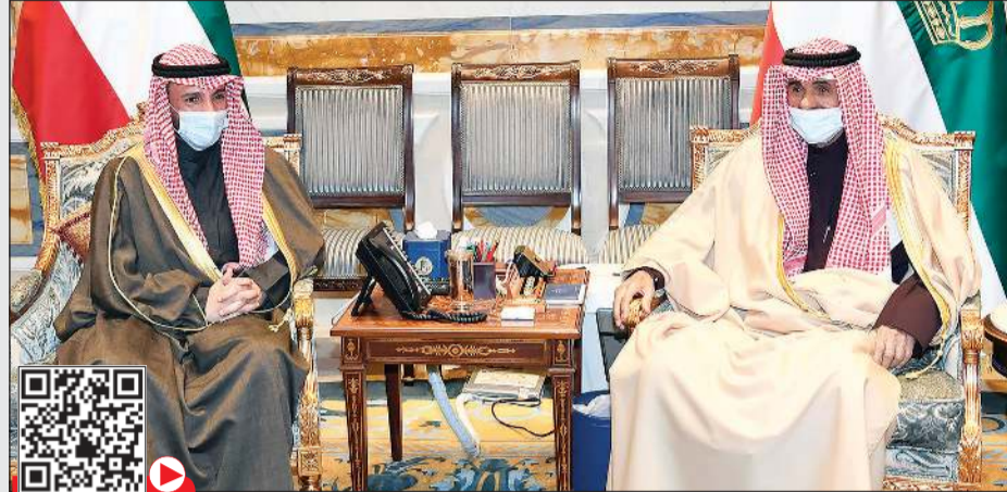
صاحب السمو الأمير الشيخ نواف الأحمد خلال استقباله رئيس مجلس الأمة مرزوق الغانم

أن يتغمده بواسع رحمته ويسكنه فسيح جناته. كما بعث سمو رئيس مجلس الوزراء الشيخ صباح الخالد ببرقية تعزية مماثلة.