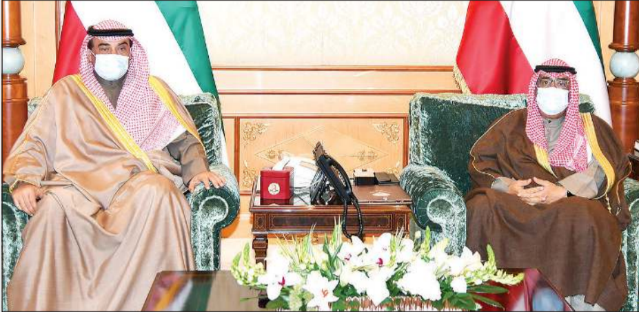
سمو ولي العهد الشيخ مشعل الأحمد خلال استقباله سمو الشيخ صباح الخالد