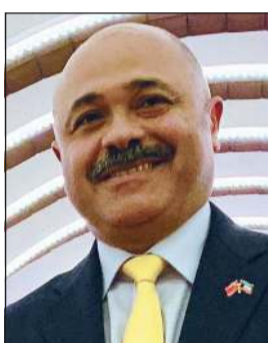
القنصل مشعل الشمالي