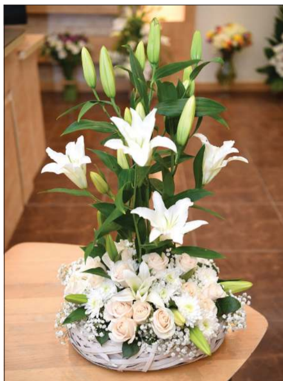
بوكيه من الزهور قدمه السفير السوداني عبدالمنعم أحمد الأمين في عيد «الأنباء»