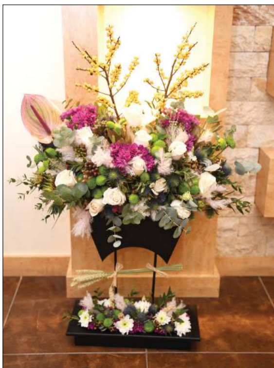
زهور من أمين عام منظمة الاقطار العربية المصدرة للبترول علي بن سبت