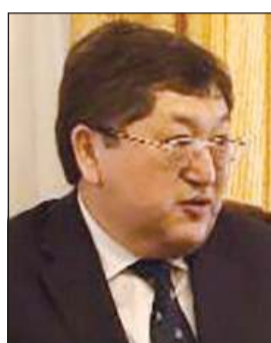
السفير عظمة بيرديباي