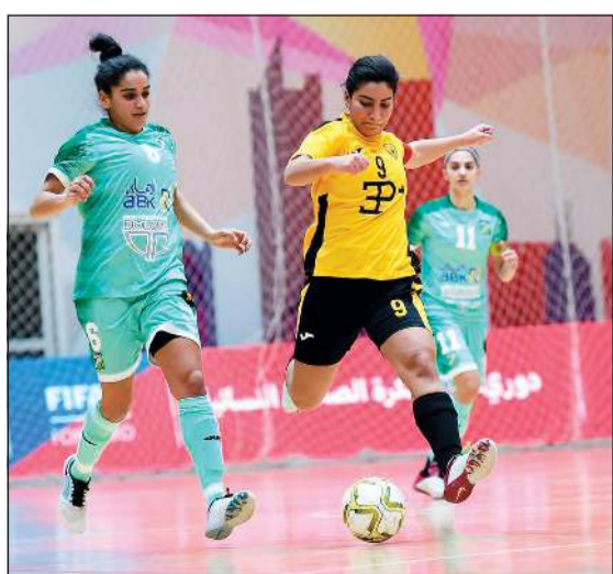
سيدات القادسية خطفن فوزاً مهماً من العربي