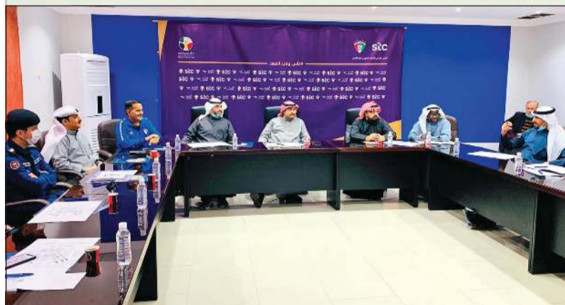
جانب من الاجتماع التنسيقي لنهائي كأس سمو ولي العهد