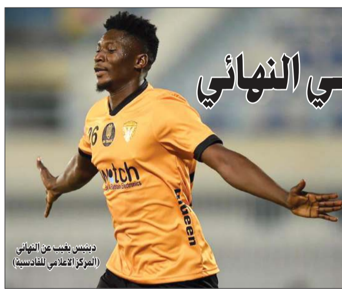
دينيس يغيب عن النهائي (المركز الاعلامي للقادسية)

يفضل ارتفاع معدل لياقته بصورة أفضل حتى لا يتعرض لإصابات عضلية بسبب فترة الغياب الطويلة عن المباريات، ومن المتوقع عودته مع انطلاقته الدوري الممتاز 21 الجاري. وحتى الآن لا توجد أي مشكلة لدى المدرب فرانكو في خط الدفاع، خصوصا على مستوى الظهيرين بتواجد الألباني لورانس تراشي والأردني عدي الصيفي وضاري سعيد، كما يمكنه الاستعانة بأحد لاعبي الشباب.