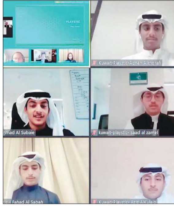
من مسابقة إنجاز التي تمت إلكترونياً هذا العام