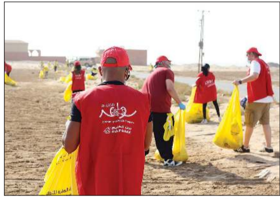
يوم التنظيف العالمي