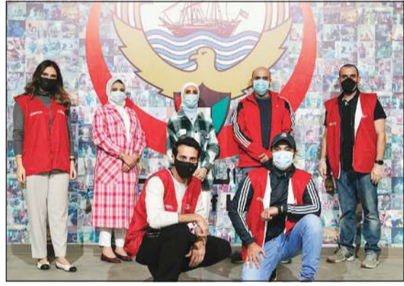
فريق بنك الخليج في مركز الفحص السريع

استدامة الاقتصاد إنجاز ضمن التزامه المتمكن الشركات طويلة الأمد، قدم بنك الخليج دعمه لمؤسسة إنجاز الكويت، وهي جمعية غير حكومية وغير ربحية هدفها تطوير المواهب الشابة وتعزيز ثقافتهم المالية ودورهم على مستوى قطاع الأعمال. كجزء من شراكته الاستراتيجية المستمرة مع إنجاز، رعى بنك الخليج مسابقة «برنامج الشركة» السنوية التي تنظمها «إنجاز الكويت» حيث عرض الطلاب أفكارهم التجارية على لجنة من الحكام. وفي ظل ظروف هذا العام، تم تنظيم المسابقة إلكترونياً، وحصل كل من الفائزين على جوائز قيمة برعاية من بنك الخليج.