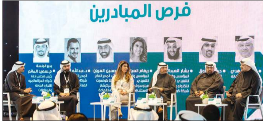
المتحدثون في ملتقى المناقصات للمشروعات الصغيرة والمتوسطة

بإعادة تدوير النفايات. ومن خلال هذه الشراكة، يلتزم البنك بإعادة تدوير النفايات الورقية والبلاستيكية، عبر مجموعة من حاويات إعادة التدوير الموزعة استراتيجياً أمام المقر الرئيسي لبنك الخليج، ويساهم بكل تأكيد في رفع مستوى الوعي لدى كل من إرهاباء، على مقربة من هذا المبنى الشهير في قلب مدينة الكويت.