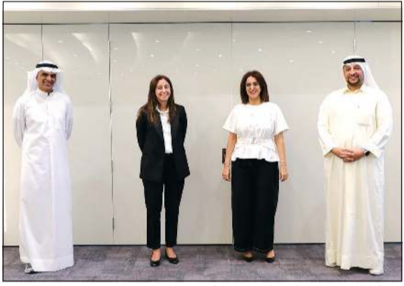
لجنة تحكيم مسابقة برنامج الشركة 2020