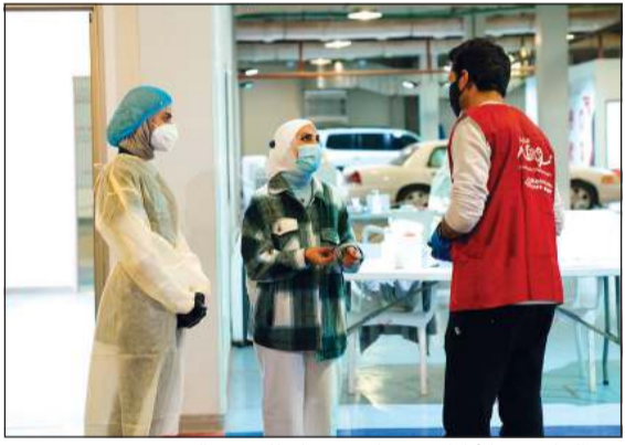
بنك الخليج مع الأطباء في مركز صباح للفحص السريع