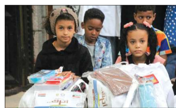
المشروع يوفر كل احتياجات اليتيم

كان لها الكثير من التداعيات منها وجود الآلاف من الأيتام اليمنيين بدون كفاية وهؤلاء الأيتام يحتاجون إلى من يوفر لهم حاجاتهم الأساسية من الغذاء والكساء والتعليم. وحث الدبوس المحسنين وأصحاب الأيادي البيضاء على المساهمة في دعم مشروع «اترك أثراً في دنياك»، مذكراً بقول النبي ﷺ: «أنا وكافل اليتيم في الجنة كهاتين، وأشار بإصبعيه يعني السبابة والوسطى»، ودعا من أراد الاستفسار على كفاية يتيم إلى الاتصال على رقم أو زيارة مقر زكاة الفحيحيل بمنطقة الفحيحيل.