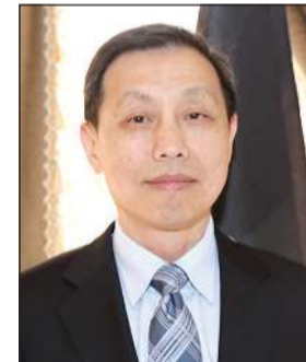
السفير الصيني لي مينغ قانغ

المدى بحلول عام 2035، كما أن الكويت ستواصل الدفع نحو تحقيق «رؤية الكويت 2035» في ظل قيادة صاحب السمو الأمير الشيخ نواف الأحمد وسمو ولي العهد الشيخ مشعل الأحمد، وفي الوقت نفسه، بصادف عام 2021 الذكرى الـ 50 لتأسيس العلاقات الدبلوماسية بين الصين والكويت، فلنتقدم يداً الصين والكويت، فلنتقدم يداً بيد للتغلب على الصعوبات، واستقبال آفاق وأعدة لعلاقات الشراكة الاستراتيجية الصينية - الكويتية.