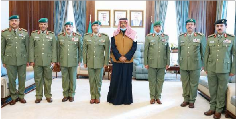
الفريق أول م. الشيخ أحمد النواف خلال استقباله العميد م. عصام نايف والعقيد أحمد عبدالرحمن عبداللطيف بحضور الفريق الركن م. هاشم الرفاعي وقيادات الحرس

عبدالرحمن عبداللطيف إلى رتبة عميد، وتعيينه وكيلًا مساعداً للحرس الوطني ويعامل معاملة وكيل وزارة مساعد. وهنا الشيخ أحمد النواف كلا من العميد م. عصام نايف، والعميد أحمد عبدالرحمن عبداللطيف على ثقة القيادة السياسية، ونقل إليهما تبريكات سمو الشيخ سالم العلي رئيس الحرس الوطني، وحثهما على بذل مزيد من الجهد والعطاء لكل ما من شأنه تقدم الكويت والحرس الوطني.