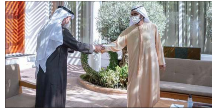
مبعوث صاحب السمو الأمير يسلم الرسالة إلى صاحب السمو الشيخ محمد بن راشد آل مكتوم

عمان الشقيقة، تضمنت العلاقات الأخوية المتينة والوطيدة التي تربط البلدين والشعبين الشقيقين وسبل دعمها وتعزيزها في مختلف المجالات وعلى كافة الأصعدة كما تضمنت آخر المستجدات على الساحتين الإقليمية والدولية. وقد سلم مبعوث سموه الرسالة الخطية إلى صاحب السمو فهد بن محمود آل سعيد نائب رئيس الوزراء لشؤون مجلس الوزراء في سلطنة عمان الشقيقة.