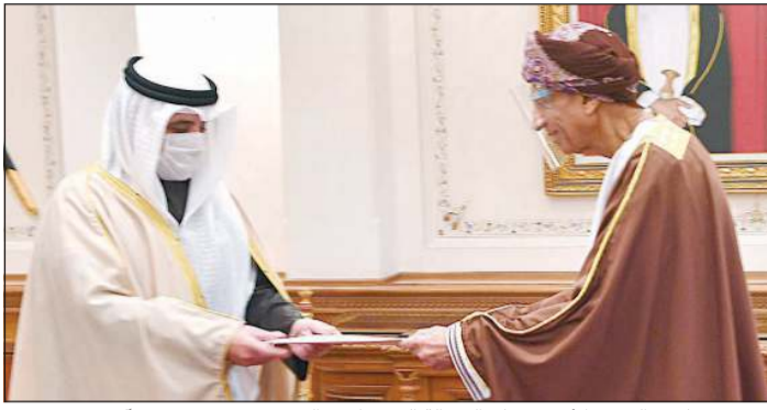
مبعوث صاحب السمو الأمير يسلم الرسالة إلى صاحب السمو فهد بن محمود آل سعيد