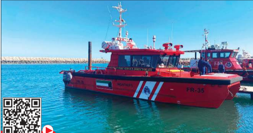
أليات الإطفاء خلال عمليات البحث