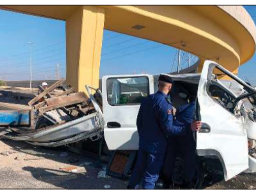
أحد رجال الإطفاء خلال معاينة المركبة

تمكن رجال 3 فرق للإطفاء من السيطرة على حريق اندلع في جاحور في منطقة الهجن فجر امس الأول. وذكرت قوة الإطفاء العام في بيان لها ان بلاغا ورد إلى غرف عمليات الإطفاء يفيد عن نشوب حريق في قسيمة بالهجن تبلغ مساحتها الإجمالية 1250 مترا مربعا تقريبا، وعلى اثر البلاغ توجهت فرق الإطفاء من مراكز كبد والجلبب والإسناد، حيث شرع رجال الإطفاء بمكافحة الحريق وتمت محاصرته من جميع الاتجاهات والعزل لعدم انتقال النيران إلى باقي القسائم، وأضافت الإدارة أن القسيمة تحتوي على أخشاب وأعمال نجارة وتخزين مواد سريعة الاشتعال وأصباغ إلى حين تمكنت فرق الإطفاء من فرض سيطرتها التامة على الحادث الذي لم يسفر عن وقوع إصابات بشرية وراقصت الأضراس فقط على المايبات. هذا وقد باشرت مراقبة التحقيق في حوادث الحريق بعملها لمعرفة مسببات الحادث. حضر إلى الموقع رجال الأمن والطوارئ الطبية.