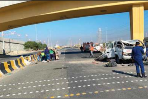
الهاف لوري وقد سقط من أعلى الجسر

أسفر حادث انقلاب مركبة نوع هاف لوري عن إصابة وافدين على جسر للاستدارة على طريق الملك فهد، وذكر بيان لقوة الإطفاء أن بلاغا ورد عن حادث سير، وعلى الفور توجه رجال الإطفاء والأمن إلى موقع البلاغ وتبين أن الحادث عبارة عن انقلاب هاف لوري من أعلى جسر، وعلى الفور تم التعامل مع البلاغ وإخراج الوافدين وتسليمهما إلى رجال الطوارئ الطبية، وجار متابعة الحادث من قبل رجال المرور للوقوف على أسبابه.