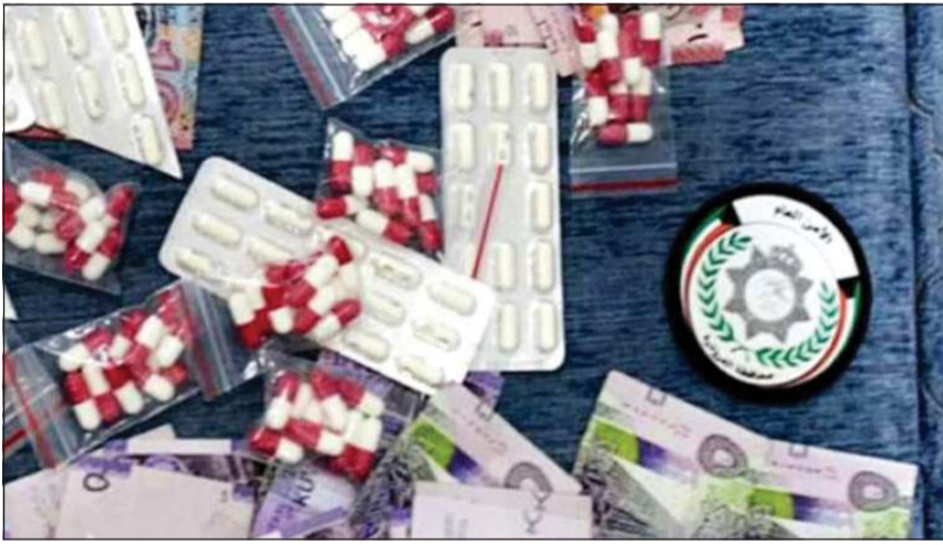
المضبوطات من الحبوب المخدرة والعملات النقدية

وعليه تم إخضاعه ومركبته للفتيش ليعثر رجال الأمن على كمية من الحبوب المنوعة، ولدى سؤاله عن أسباب حيازة هذه الحبوب أقر بانها للاتجار.