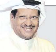
الفريق م. طارق حمادة

أي هيكل وزاري يمكن تغييره بما يلي الأهداف المرجوة وقابل للتعديل وهذا ما حدث فعليا بدمج أمن الحدود وخفر السواحل والمرور والنجدة تحت قيادة واحدة ممثلة في اللواء جمال الصايغ ونفذ ذلك ولم يتأثر العمل بل أصبحت هناك مرونة للكلاء بتلك الإدارات في توظيف الطاقات الخ. في لقاء الوزير بالمديرين العاملين ومساعدتهم حرص على التذكير بثوابت العمل الأمني وضرورة الالتزام بتوجيهات القيادة السياسية بتطبيق القانون على الجميع ومكافحة الفساد ومواجهة التحديات والمخاطر والتصدي لكل من تسول له نفسه العبث بأمن البلاد وتجسيد احترام القانون، وهذه التعليمات وجب الالتزام بها بدقة لتحقيق العدالة.