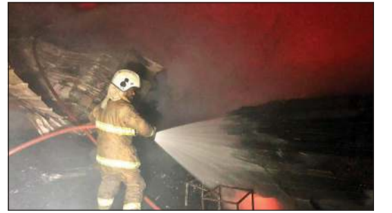
أحد رجال الإطفاء يحكم السيطرة على السنة الذهب