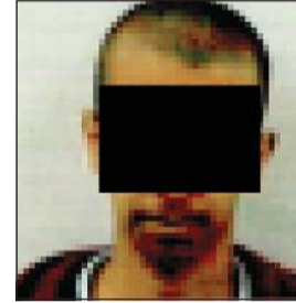
..والثاني في قبضة مباحث الأحداث