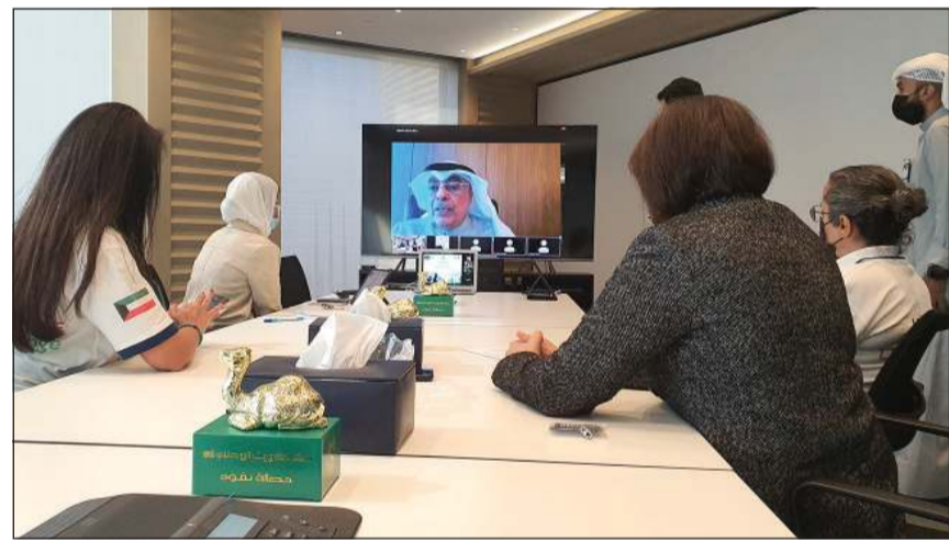
جانب من حفل التكريم «أونلاين» أثناء مشاركة ممثل وزارة التربية الوكيل المساعد فيصل المقصيد

كما أكد مقصيد أن غرس المفاهيم البيئية لدى طلبتنا هو أمر ضروري، متمنيا ازدياد عدد المشاركات