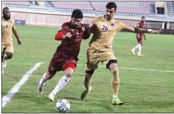
فوز هام لبرقان على النصر (ريليش كورما)