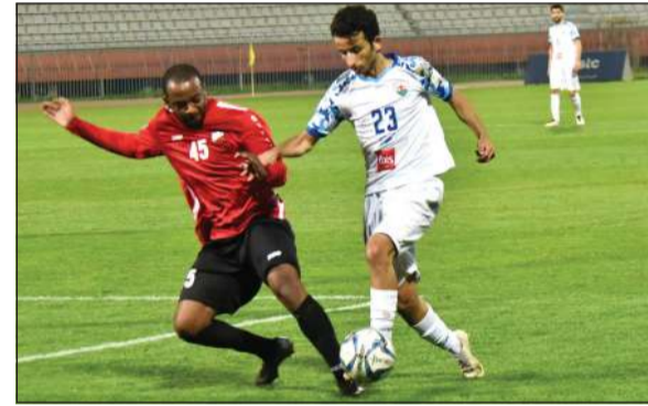
خيطان حقق فوزاً ثميناً على الجھراء (محمد هنداري)