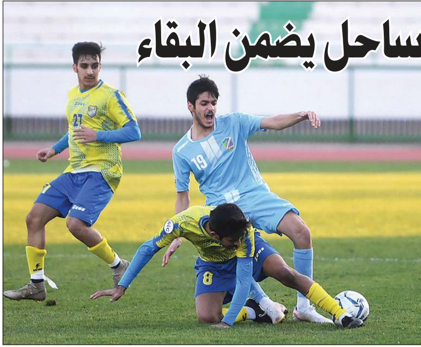
الساحل أوقف خطورة لاعبي السالمية وخرج بنقطة