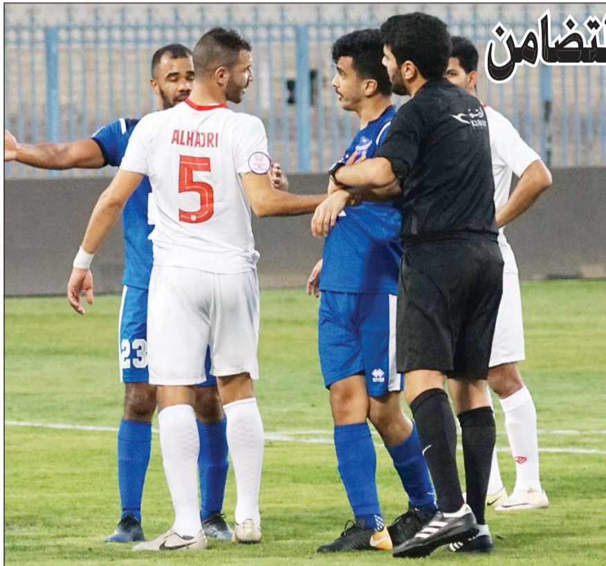
جانب من لقاء سابق بين الكويت والتضامن (محمد هنداري)