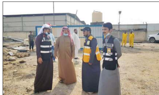
فريق بلدية الفروانية خلال الجولة

الجمالية بمناطق المحافظة والنصدي لكل التجاوزات ورفع مستوى النظافة والقضاء على كافة السلبيات التي تشوه المنظر الجمالي من سيارات مهمله وغيرها، مؤكداً أن المفتشين في الإدارة لن يتهاونوا في تطبيق الشروط والضوابط التي تضمنتها لائحة النظافة العامة وإشغالات الطرق لتحقق انسيابية الحركة والمحافظة على الشكل الجمالي بمناطق المحافظة بما يحقق المصلحة العامة ورفع كفاءة المخلفات.