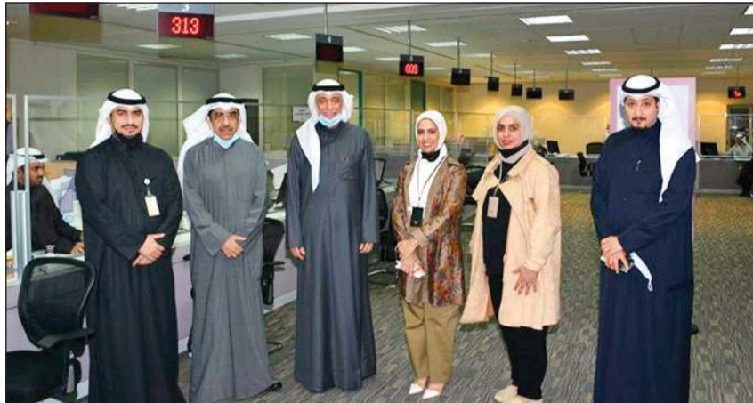
د.عبدالله معرفي وم.بدر الوقيان خلال تفقد عمل قطاعات «السكنية».

تفقد وزير الدولة لشؤون الإسكان وزير الدولة لشؤون الخدمات د.عبدالله معرفي أمس مشروع مدينة المطلاع الإسكاني بحضور مدير عام المؤسسة العامة للرعاية السكنية وعدد من القياديين الآخرين.