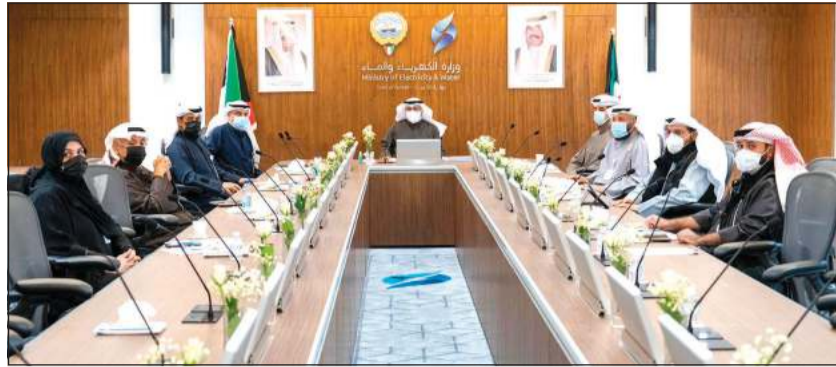
وزير الكهرباء والماء د.محمد الفارس مترشدا الاجتماع الأول له بقيادته الوزارة

اجتمع وزير النفط وزير الكهرباء والماء د.محمد الفارس صباح أمس مع وكلاء وزارة الكهرباء والماء لمناقشة عدد من المواضيع المتعلقة ببناء قطاعات الوزارة المختلفة لتقييم الوضع الراهن بشأن سير عمل الوزارة التي تعد من أهم الوزارات ذات الطابع الفني.