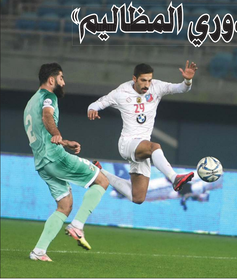
العربي يعوض خسارة كأس السوبر ويفوز على الكويت بثلاثية