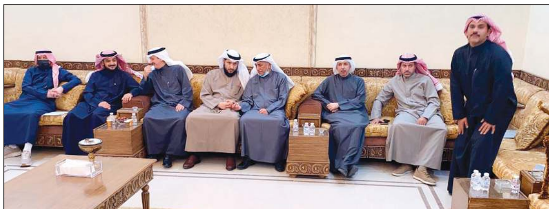
مساعد العارضي مرحباً بالنواب الحضور في ديوانه