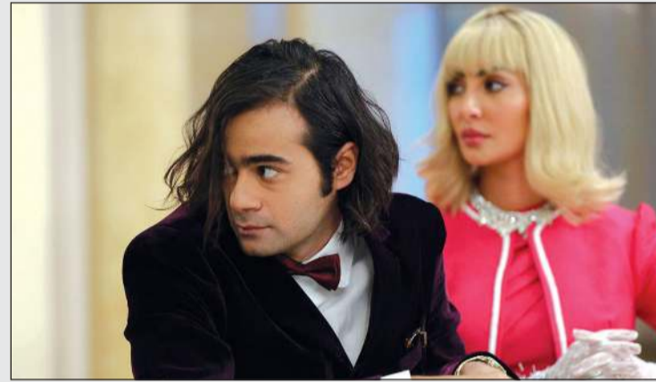
مبارك وجميلة في «دفعة بيروت»

هل تعمدت إضفاء روح الكوميديا على شخصية «مبارك»؟