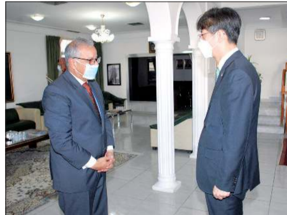
السفير الكوري دو هونغ يونج في معزيا

الشعب الباكستاني ورابطة شريف باكستان الإسلامية، بالإضافة إلى إحدى فصائلها. وأضاف: ولد مير ظفر الله خان جمالي في قرية صغيرة - روجان جمالي - من قسم نصير آباد في بلوشستان (الإمبراطورية البريطانية -