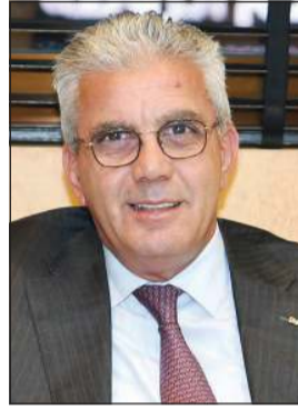
السفير رامي طهوب