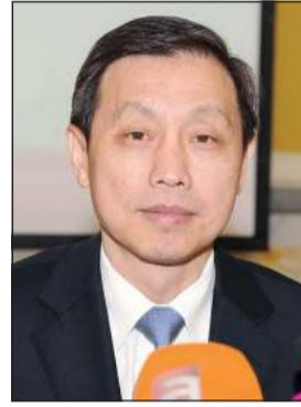
سفير الصين لدى الكويت لي مينغ قانع

الشعب الكويتي الشقيق، متمنيا لهم جميعا التوفيق في مهمتهم لما فيه خدمة ومصصلحة الكويت والشعب الكويتي الشقيق وان يسدد خطاهم لمرضاته سبحانه وتعالى. بدوره، هنأ سفير جمهورية الصين الشعبية لدى البلاد لي مينغ قانع الشعب الكويتي بالانتخابات، وقال في تصريحات صحافية: لقد أعربتكم عن عشقكم لموطنكم من خلال انتخابات سلسلة لدور انعقاد جديد لمجلس الأمة. وتابع: كما أتقدم بالتهنئة إلى المرشحين الفائزين، وإنسي متأكد انكم ستفوزون بمسؤولياتكم بتحقيق تطوعات وآمال الشعب.