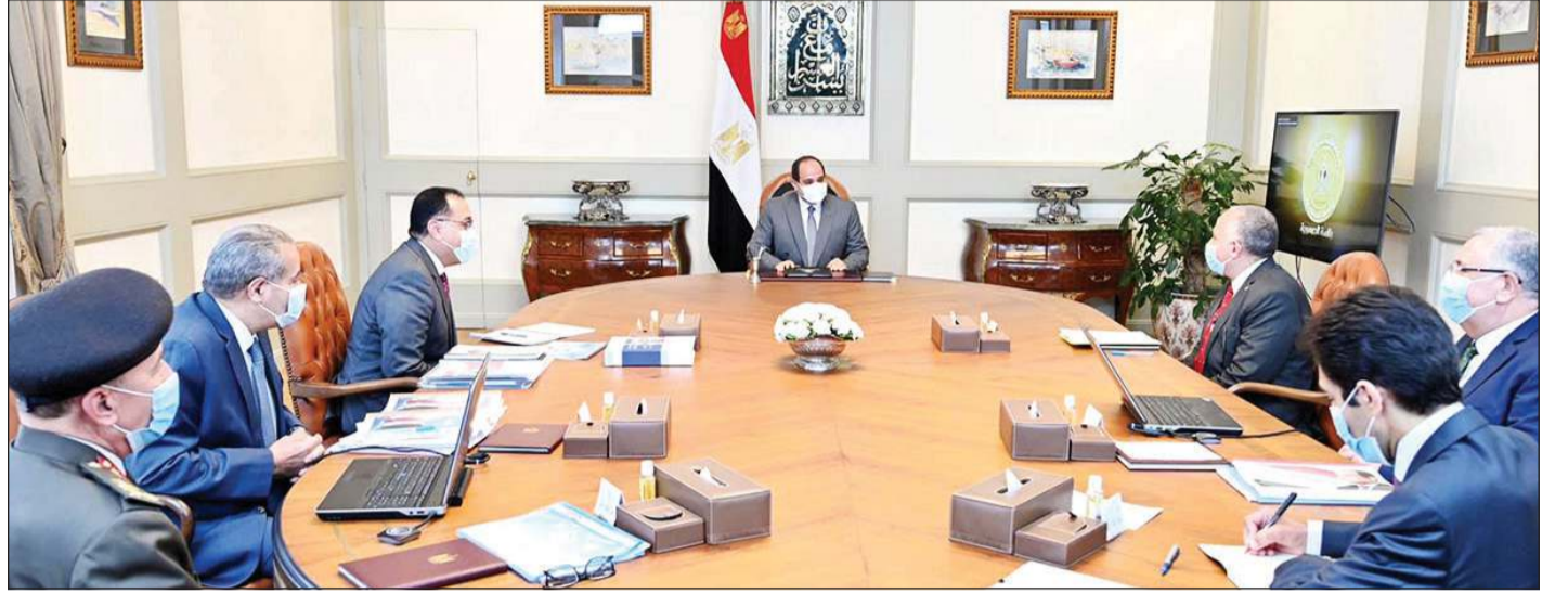
جانب من اجتماع الرئيس عبدالفتاح السيسي ورئيس الحكومة وعدد من الوزراء والمسؤولين