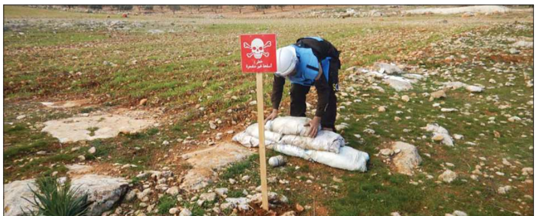
عنصر من «الخوذ البيضاء» يضع علامة قرب قنبلة عنقودية غير منفجرة في ريف حلب (أرشيف)

وعلى الرغم من المخاوف بشأن تسجيل نحو 286 ضحية جديدة بسبب استخدام الذخائر العنقودية في جميع أنحاء العالم، وبشكل الأطفال حوالي 4 من كل 10 ضحايا. وقالت ماريون لودو، المسؤولة عن إعداد التقرير، إن «الاستخدام المستمر للذخائر العنقودية المحظورة في سورية، والاستخدام الجديد لها في ليبيا وناغورنو كاراباخ، أمر غير مقبول».