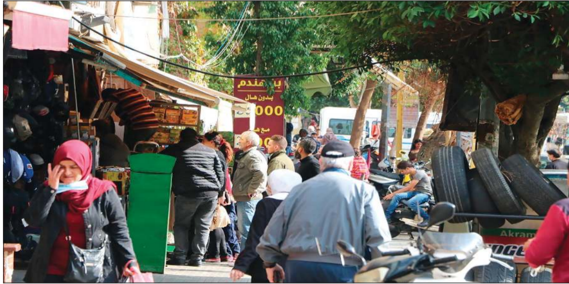
عودة فتح المحلات التجارية والأسواق والمطاعم في بيروت بعد إغفال تام استمر أسبوعين

رئيس مجلس النواب نبيه بري، سئل عن معلوماته حول ما تردد عن تحرك قطار تشكيل الحكومة، فأجاب: لا معلومات لدى تشير إلى الانفراج الحكومي، الذي يجري التداول به في وسائل الإعلام، مختصراً لصحيفة «النهار» بالقول: «حالتنا بالويل»، لكنه أكد انه سيبقى في مقدمة مهسلي تشكيل الحكومة، والا مشكلة عنده في الأسماء، كاشفاً انه سبق له، منذ 20 يوماً، أن سلم الحريري تشكيلة أسماء مرشحة للتوزير، وهم من الاخصاصيين، ولا علاقة لهم بحركة أمل، وترك له اختيار اثنين منهم، وقال بري: ليس المطلوب الوقوف على «الدقة ونص»، في إسقاط الأسماء المطروحة على الحقائق، وليس المهم زيارة الحريري إلى قصر بعبدا، إنما الأهم اتفاهلها على توليفة حكومية. ودعا بري لجان المال