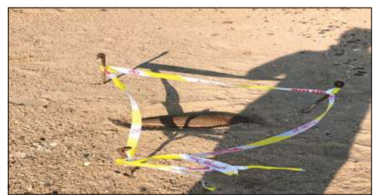
القذيفة قبل التعامل معها

توجهت قوة من هندسة الجيش إلى بر السالمي وتحديداً إلى نحو 800 متر بداخله، وذلك للتعامل مع لغم أبلغ مواطن عن وجوده في البر وتبين أنه من مخلفات الغزو ولكنه في حالة صالحة ويمكن أن يتفجر. واستناداً إلى مصدر أمني فإن عمليات وزارة الداخلية ممثلة في مديرية أمن الجهراء أرسلت دورية إلى موقع البلاغ، وأقامت سباجاً حوله ليتمكن وصول رجال المتفجرات والتعامل معه.