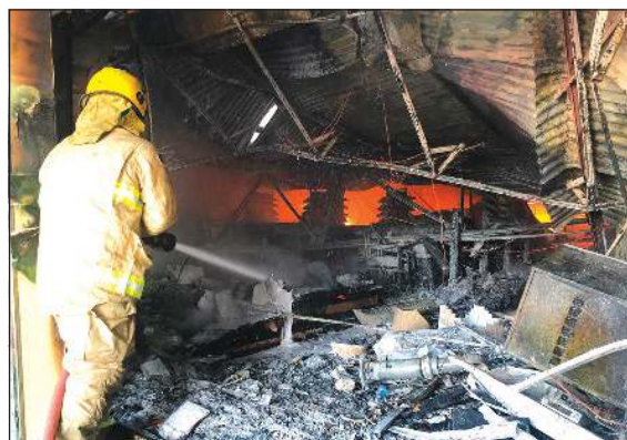
أحد رجال الإطفاء خلال تعامله مع حريق أمس الأول

قال مصدر مطلع في الإدارة العامة للإطفاء أنه حتى ظهر امس لم يتم العثور على أي أثر للمفقود داخل سوق الشويخ المركزي والذي ألتف بالكامل جراء الحريق الضخم الذي اندلع به صباح الثلاثاء، مشيراً إلى أن هناك كمية كبيرة من ركام السوق جار رفعها بحيث تتكشف كامل مساحة السوق ويتم التأكد بشكل قطعي من وجود مفقود بداخله ام لا. وأضاف المصدر حتى امس لم يتم العثور على المفقود حيث أنه لم يتوجه إلى منزله أو إلى أي مرفق علاجي وهو ما يعزز فرصة كونه تحت الانتقاض على الأرجح أو أن يكون هناك سر وراء عدم وجوده. وعلى صعيد الأسباب المتوقعة للحريق قال المصدر: مثل هذه الحرائق الكبيرة تحتاج إلى وقت قد يستمر لأيام حتى يتم الوقوف على سبب اندلاع الحريق وإذا ما كان مفتعلاً ام لا.