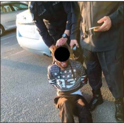
صورة أرشيفية للقائد بعد القبض عليه قبل 4 أعوام