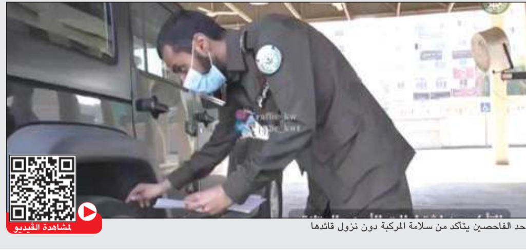
أحد الفاحصين يتأكد من سلامة المركبة دون نزول قائدها