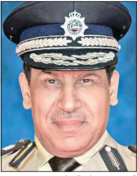
الفريق عصام النهام

دعت وزارة الداخلية الراغبين في مواصلة دراستهم من أعضاء قوة الشرطة في المراحل الدراسية حتى الثانوية أو ما يعادلها التقدم بطلب للإدارة العامة لشؤون قوة الشرطة للحصول على إجازة شريطة أن يكون مستوفياً الشروط العامة والخاصة الوزارة المشار إليه أعلاه وذلك حسب مراحل التنظيم التالي: