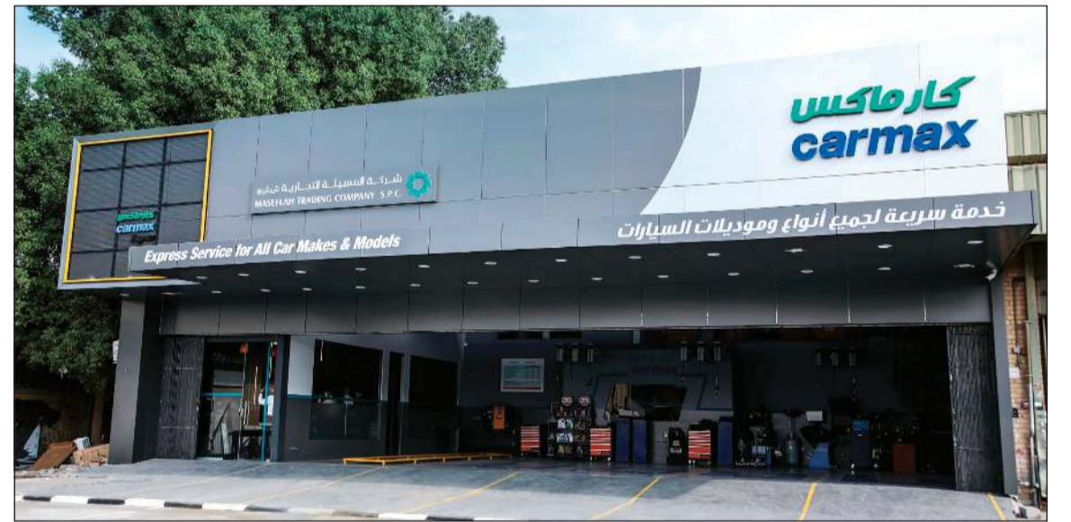
مركز خدمة «الملا كارماكس» الجديد

وتغطي خدمات المركز مجموعة واسعة من المنتجات مثل فلتر الزيت وسائل التبريد ومواد التشحيم وعناصر منظف الهواء وأنظمة الفرامل والبطاريات والإطارات.