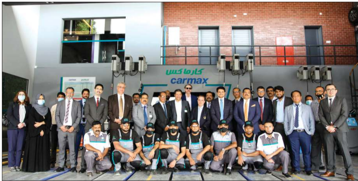
صورة جماعية لفريق عمل شركة الملا للسيارات