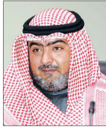
الشيخ ثامر العلي