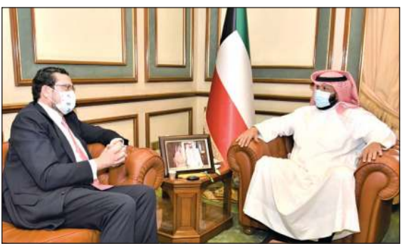
الشيخ طلال الخالد مستقبلاً السفير الإسباني ميغيل اغيلار

استقبل محافظ العاصمة الشيخ طلال الخالد أمس الثلاثاء في مكتبه بديوان عام المحافظة، سفيري جمهورية العراق المنهل حسين الصافي، ومملكة إسبانيا ميغيل اغيلار، وذلك بمناسبة توليها مهام منصبيهما الجديدين كسفيران لبلادهما في الكويت.