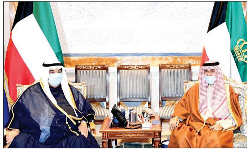
صاحب السمو الأمير الشيخ نواف الأحمد مستقبلاً سمو الشيخ ناصر المحمد

الحرمين الشريفين. وبعث سمو ولي العهد الشيخ مشعل الأحمد ببرقية تهنئة إلى أخيه خادم الحرمين الشريفين الملك سلمان بن عبدالعزيز آل سعود ملك المملكة العربية السعودية الشقيقة ضمنها سموه خالص تهنائه بمناسبة الذكرى السادسة لتوليه مكالمة الحكم، مشيداً سموه بما حققته المملكة العربية السعودية الشقيقة من إنجازات تنموية شاملة في عهده الميمون، ومبتغلاً سموه إلى الجاري جل وعلاً أن يديم على أخيه خادم الحرمين الشريفين موقوره الصحة وتمام العافية ويحقق للمملكة العربية السعودية الشقيقة كل الرقي والازدهار تحت ظل قيادته الحكيمة. كما بعث سمو رئيس مجلس الوزراء الشيخ صباح خالد ببرقية تهنئة مماثلة.