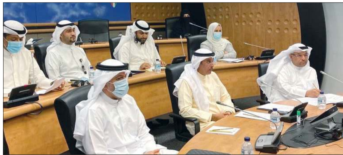
الوزير المفوض حمد المشعان مترشدا الجانب الكويتي من المحادثات

جيد لتلبية الاحتياجات المستقبلية للكويتيين مع نمو البلاد وتنوعها. يذكر أن العلاقات بين البلدين قامت عام 1974 في حين يبلغ عدد الطلبة الكويتيين الدارسين في أستراليا 361 طالبا فيما يقدر حجم الاستثمارات الكويتية في أستراليا بنحو 15 مليار دولار.