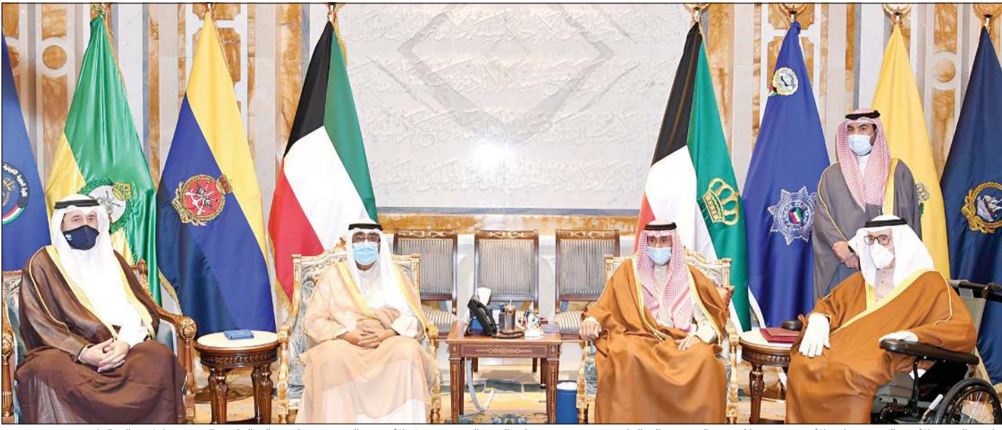
صاحب السمو الأمير الشيخ نواف الأحمد مستقبلاً سمو الشيخ سالم العلي بحضور سمو ولي العهد الشيخ مشعل الأحمد والشيخ د. علي سالم العلي والشيخ مبارك سالم العلي