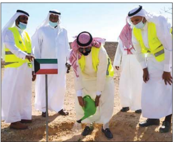
الشيخ علي الخالد لدى مشاركته في عملية التشجير

شارك سفيرنا لدى المملكة العربية السعودية الشقيقة الشيخ علي الخالد في تشجير منتزه محافظة حريملاء بمنطقة الرياض. وكان في استقبال السفير الخالد لدى وصوله في منتزه حريملاء الوطني المدير العام لفرع وزارة البيئة والمياه والزراعة بمنطقة الرياض د.ماجد الفراج وبحضور رئيس بلدية محافظة حريملاء د.محمد القرني وعدد من منسوبي الوزارة ومكتب