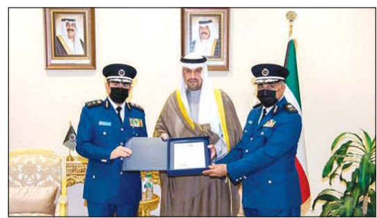
الوزير أنس الصالح يتسلم شهادة أيزو، الإطفاء