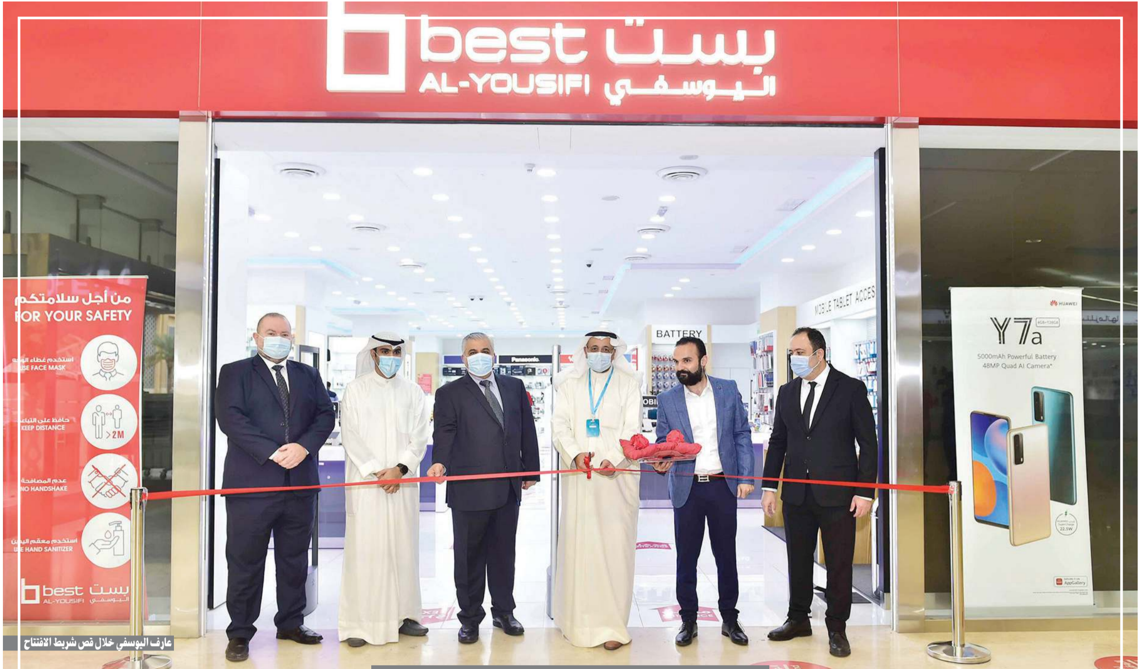
ضمن إطار سياستها التوسعية في مناطق الكويت