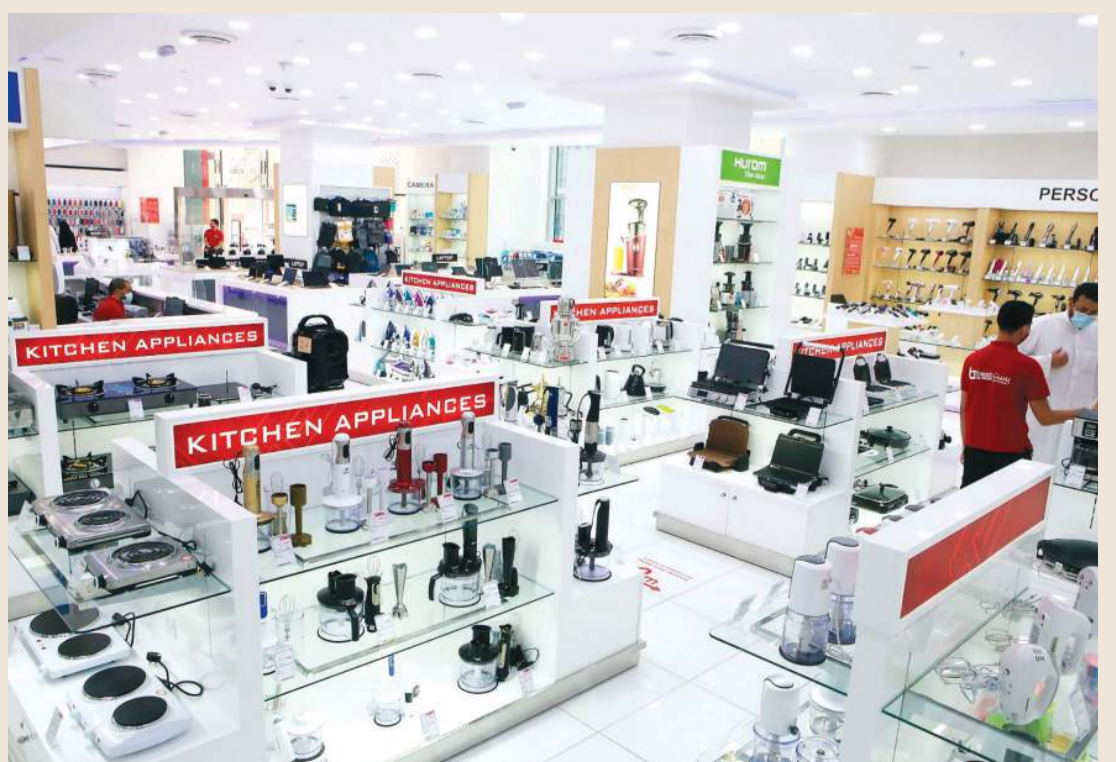
صورة داخل المعرض