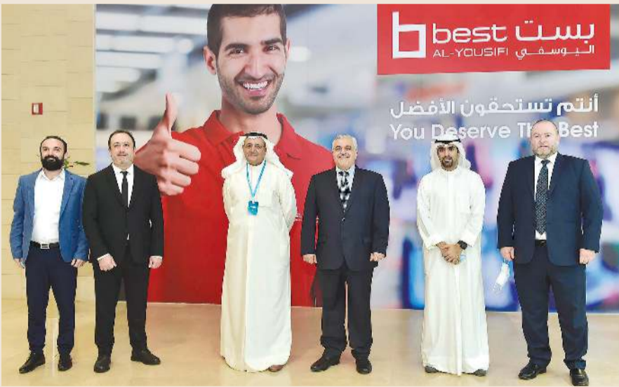
جماعية لمدراء الشركة