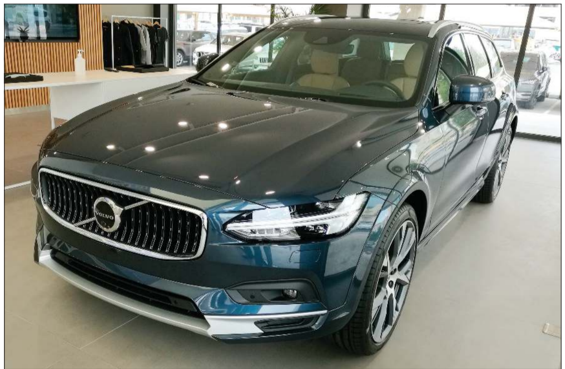
فولفو V90 Cross Country

ركناً خاصاً يقدم كل أنواع المشروبات الساخنة والباردة وتمتد أمام «فولفو ستوديو» حديقة ذات مساحات خضراء وأماكن للجلوس، حيث يمكن للزائرين الاستمتاع بقمم العلامة التجارية وبمجموعة منتجات الشركة الفريدة وقضاء أمتع اللحظات الهادئة.