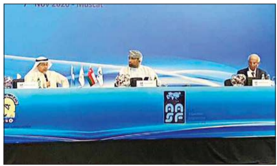
حسين المسلم متحدثاً في الجمعية العمومية الـ 14 للاتحاد الآسيوي للسباحة