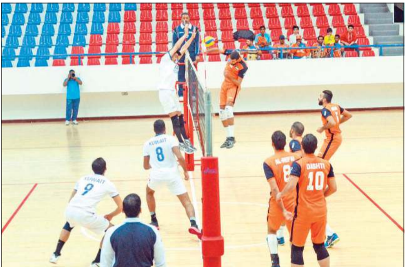
كاظمة يسعى لتعويض خسارته أمام الكويت