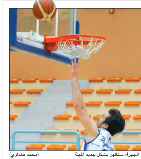
سلة الجهراء ستظهر بشكل جديد الليلة