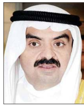
الشيخ خالد البدر