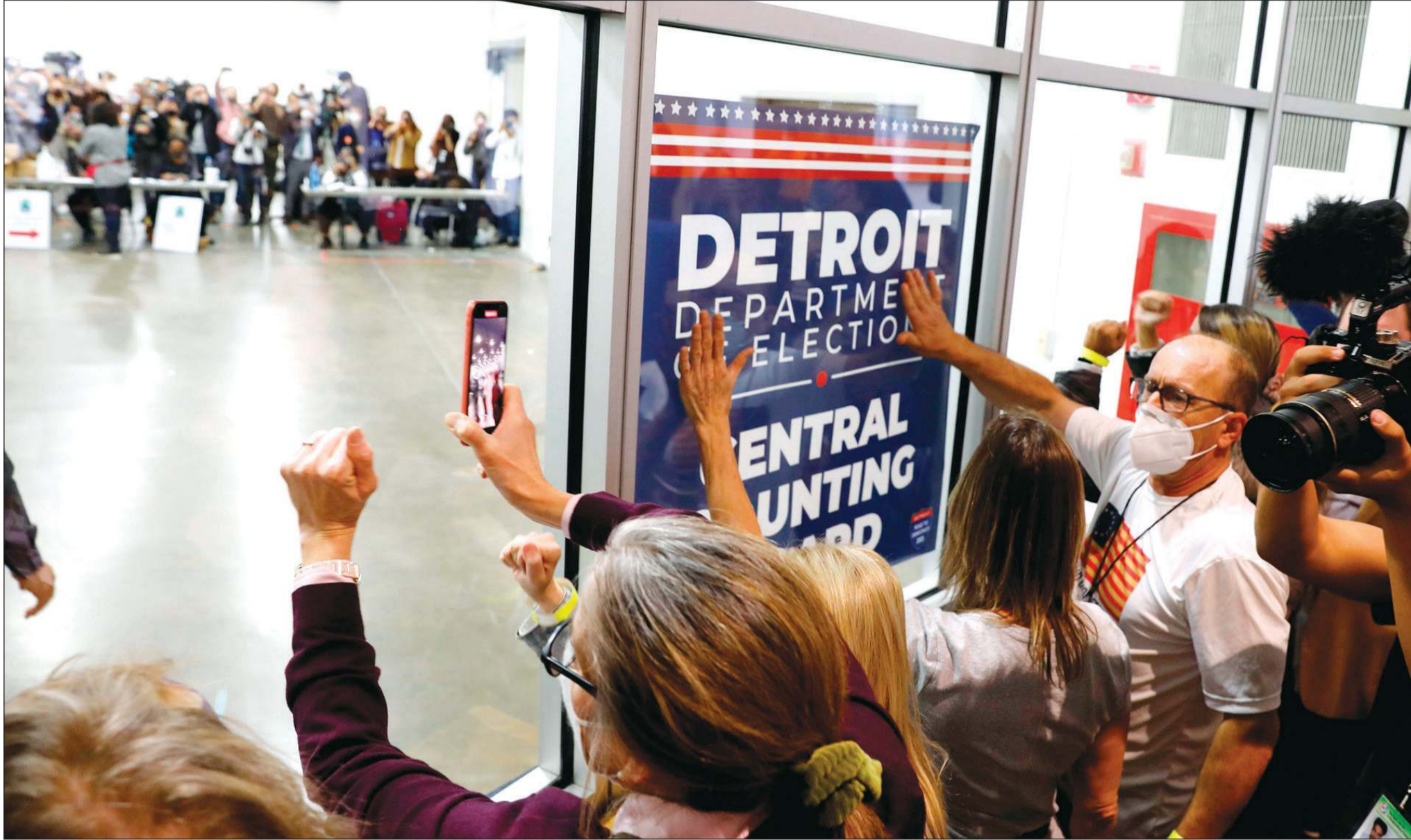
مؤيد الرئيس دونالد ترامب يطرقون زجاج أحد مراكز عد الأصوات في ديترويت بولاية ميتشيجان

ويجئ هذا الشد والخلاف عقب حملة انتخابية طغت عليها الترشقات العنيفة وسط جائحة أودت بحياة أكثر من 233 ألفا بالولايات المتحدة وأفقدت الملايين أعمالهم. كما مرت البلاد بشهور مضطربة شهدت فيها احتجاجات على العنصرية ووحشية الشرطة. وفي التصويت الشعبي على مستوى البلاد، حقق بايدن تقدما مريحا بحوالي 3.6 ملايين صوت. وفاز ترامب في انتخابات عام 2016 على الديمقراطي هيلاري كلينتون بعد فوزه بولايات حاسمة على حوالي ثلاثة ملايين صوت إضافي على مستوى البلاد.