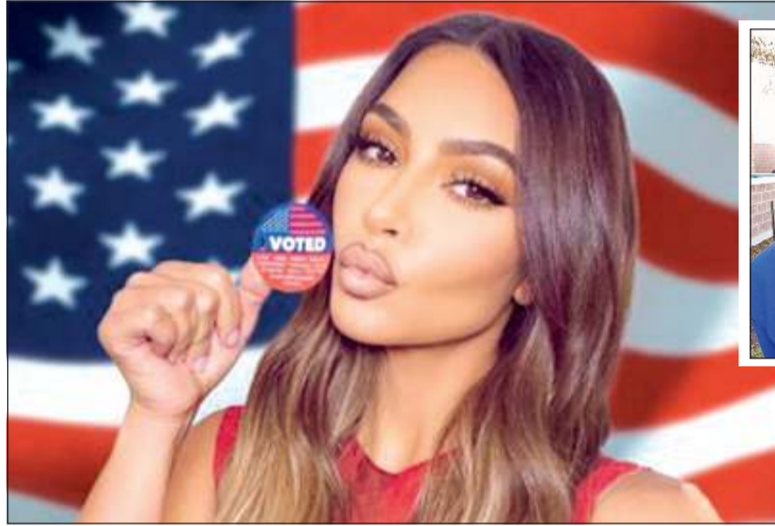
كارديشيان صوتت ولم تفصح عن انتخابته وفي الإطار كانييه ويست بعد أن أدلى بصوته لنفسه

العقلية. وكان المغني الحائز 21 جائزة غرامي قد قال عام 2018 إنه مصاب بالاضطراب ثنائي القطب. واقتصر ويست وبقا 6,7 ملايين دولار لحملته وفقاً لوثيقة قدمها للجنة الانتخابيات يوماً، وبدأ حملته الانتخابية في يوليو بتصريحات غريبة شككت البعض في قواه