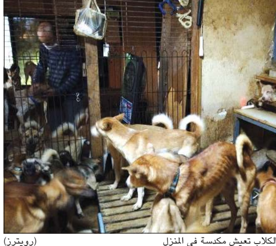
الكلاب تعيش مكتسة في المنزل