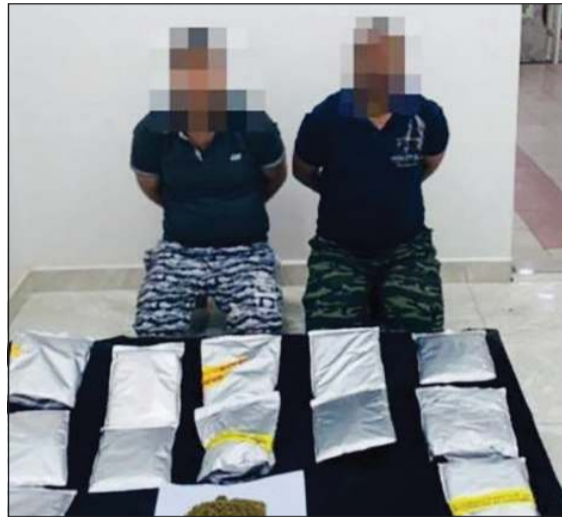
الوافدين وامامهما الكيميكال