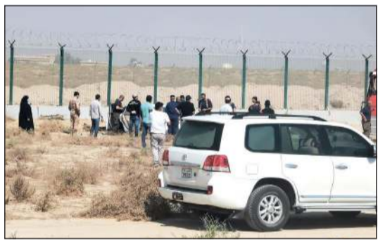
من الحادث المروري