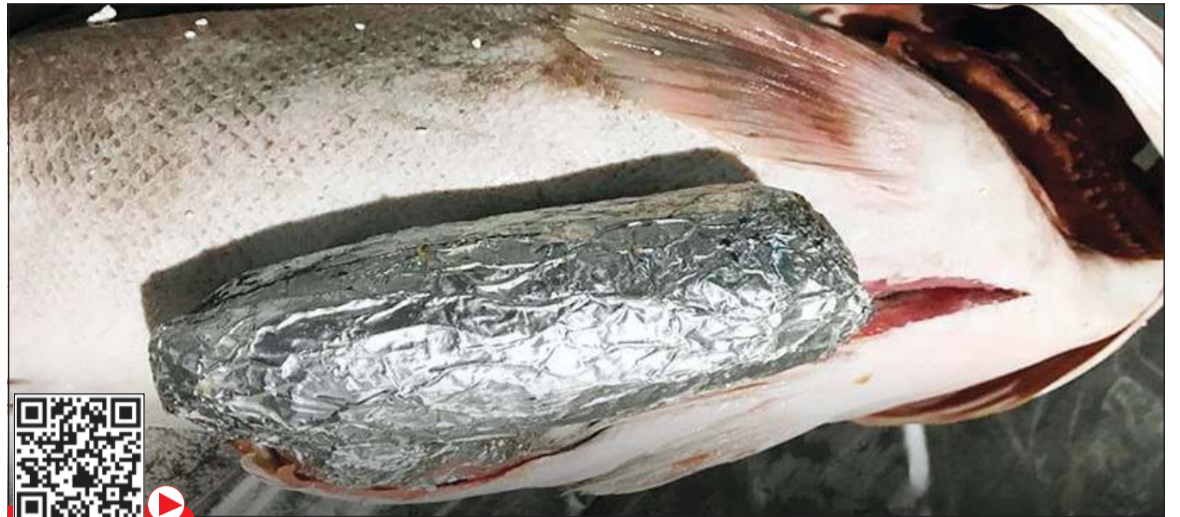
الهامور، وقد أخفي فيه الشبو بطريقة فنية