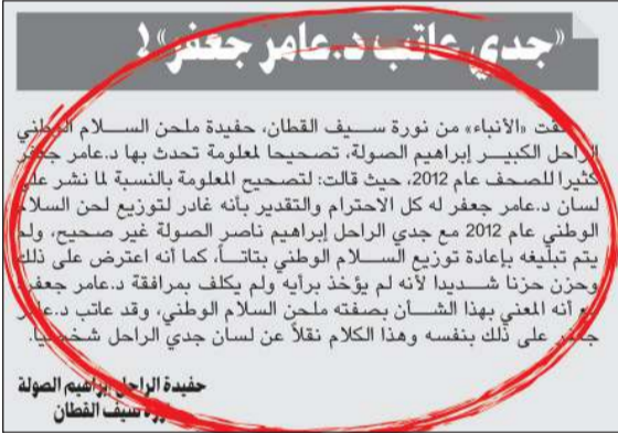
رد حفيدة الملحن إبراهيم الصولة على د.عامر جعفر الذي نشر بـ«الأنباء» أسس