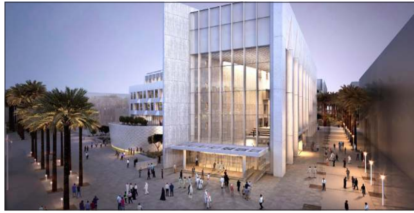
تصميم مبنى كلية العمارة