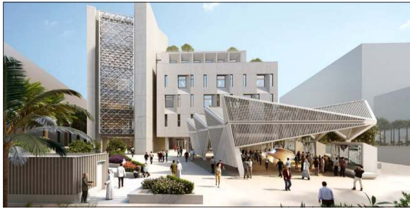
توفير بيئة تعليمية تفاعلية لمنتهي كلية العمارة