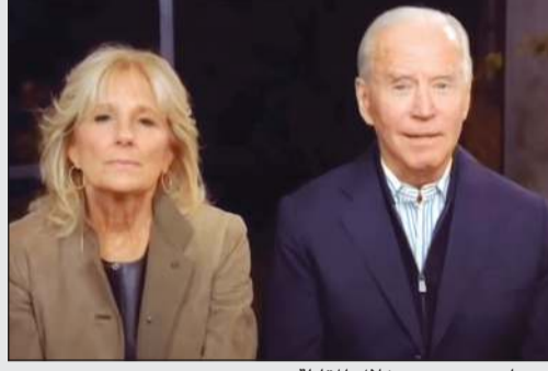
جو بايدن وزوجته خلال المقابلة

المخرج وغرد على تويتر قائلاً «جو بايدن أطلق علي اسم جورج. لم يتذكر اسمي حتى حصل على الدعم ليتمكن من إتمام المقابلة». واتهم وسائل الإعلام بالتغاضي عن هذه الهفوة، وقال «الاعلام المزيف يعمل جاهدا للتغطية على ذلك».