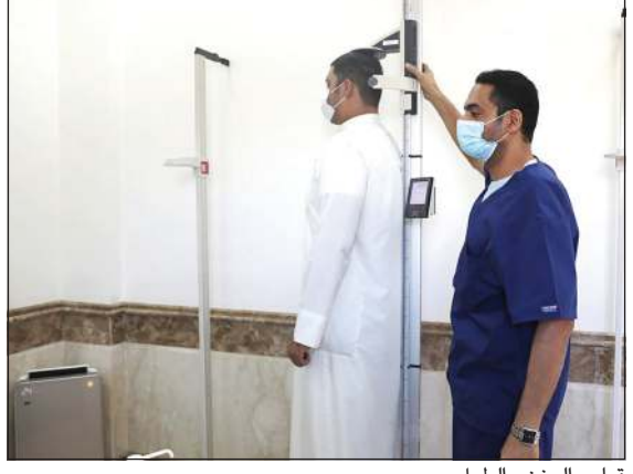
قياس الوزن والطول