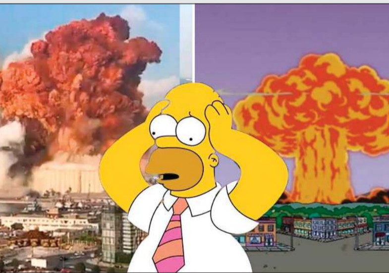
.. وانفجار مرفأ بيروت

بأحداث 9 سبتمبر، تنبأ أيضا بانفجار مرفأ بيروت، حين يظهر في إحدى حلقاته «هومر»، وهو شخصية رئيسية في المسلسل، أثناء شرائه متفجرات من متجر، وفي المشهد التالي، يحدث انفجار ضخم، وتظهر سحابة كبيرة، مثل تلك التي ظهرت في بيروت. وكذلك صدم المسلسل المشاهدين أزمة اليونان الاقتصادية والتي كان من المحتمل طردها من الاتحاد الأوروبي في حال عدم تسديدها الديون المستحقة لصندوق النقد الدولي، إلا أن المسلسل الكرتوني كان قد توقع ذلك قبل 3 سنوات في الموسم 23، وتحديدا في الحلقة العاشرة، كما توقع المسلسل قيام كندا بتشريع الماريجوانا فيها قبل نحو 13 سنة من قيام كندا بهذا فعل، في حلقة بعنوان «Rx Midnight»، التي بثت عام 2005، خلال الموسم الـ16 منه، فخلال الأحداث قبل وقوعها بسنوات، وقد أصبح من المعتاد عند حصول أي حدث عالمي، أن يذهب متابعو المسلسل إلى الحلقات القديمة لمعرفة ما إن كان تم التحدث عن هذا الأمر مسبقاً، كان آخرها الإدعاء بأن حريق كنيسة نوردام قد ورد في المسلسل ولو بطريقة غير مباشرة، وقبل أيام قليلة، ادعى متابعو المسلسل بأن الناشطة البيئية «غريتا تونبرغ» قد ظهرت في المسلسل أيضا، وقالوا إن ذلك قد حدث منذ 10 سنوات.