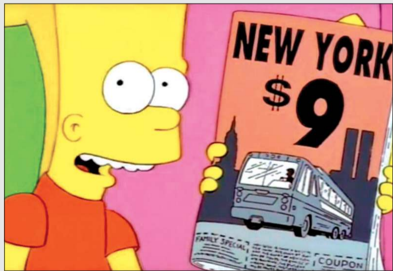
حلقة «أحداث 9 سبتمبر»

لنا بمنافسة أعمال العالم، ولا نظل متغلغلين على أنفسنا باقارنا، أو نخرج للعالم لنكون مجرد تابعين له؟ فهل نتوقع أن نجد دراما جديدة أفضل إنتاجيا وفكريا وقصصيا مما فعله (يوسف الشريف) أو غيره؟ هل نتوقع أن نجد أحداثا درامية تناقش الوضع في المستقبل القريب عربيا بخلاف مشكلة القدس وفلسطين، والنزاع على العالم العربي، ولكن أيضا التطرق لمشكلات التلوث البيئي والطقس والأمور البيئية هل سيكون لها نصيب؟ قارئ الكتاب والمنتجون ليقدّموا لنا ما يفتح العقل