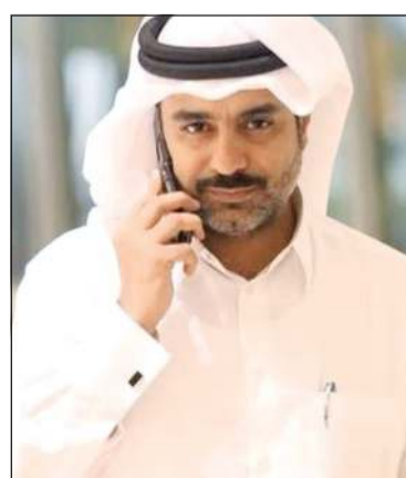
يوسف الشريف في مسلسل «النهاية»