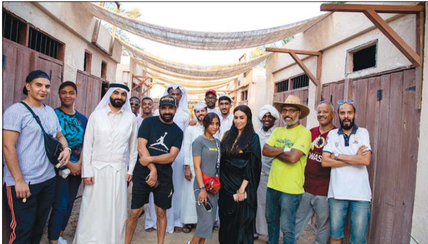
فريق عمل الفيديو كليب

■ أعتز بهويتي الخليجية وتمنيت أن أكون من هذا الزمن