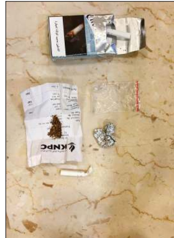
المخدرات المضبوطة بحوزة العربيين