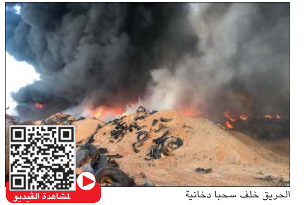
الحريق خلف سحبا دخانية