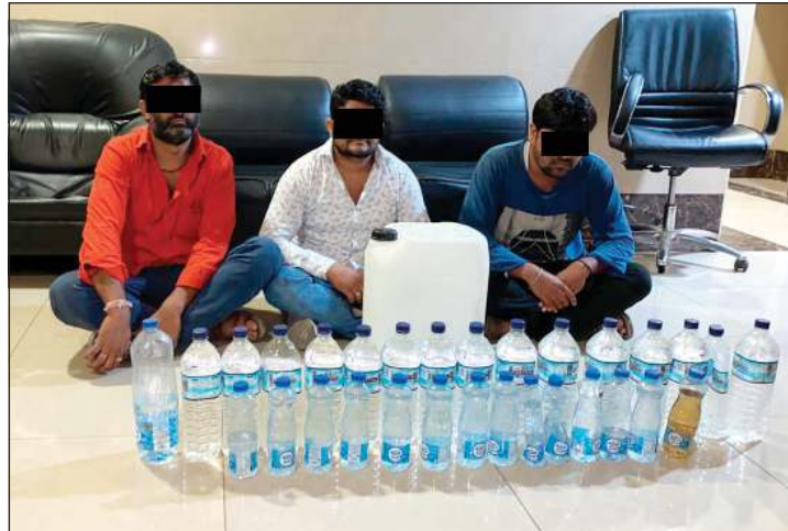
الأسويين 3 وأمامهم المضبوطات

بإحالة وافدين من جنسية عربية إلى الإدارة العامة لمكافحة المخدرات بعدما عثر بحوزتهما على مواد مخدرة. وجاءت هذه التعليمات في أعقاب إخطار مدير عام مديرية الأمن من قبل رئيس مخفر الدسة المقدم حمدان العجمي بضبط الوافدين الستة خلال حملة تفتيش مباغنة خلال 30 دقيقة في منطقة بنيد القار. وفي التفاصيل، فإن رجال أمن مخفر الدسة ومن خلال حملة بقيادة المقدم حمدان العجمي أوقف 5 مركبات للاشتباه فيها، حيث عثر بالمركبة الأولى