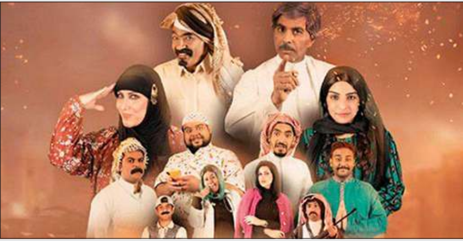
بوستر مسلسل «آل دبسمبر»