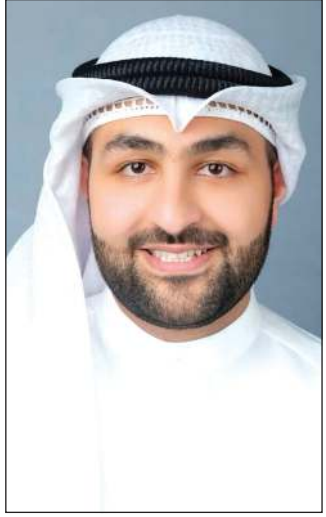
المذيع سعود عبدالعزيز الفياض