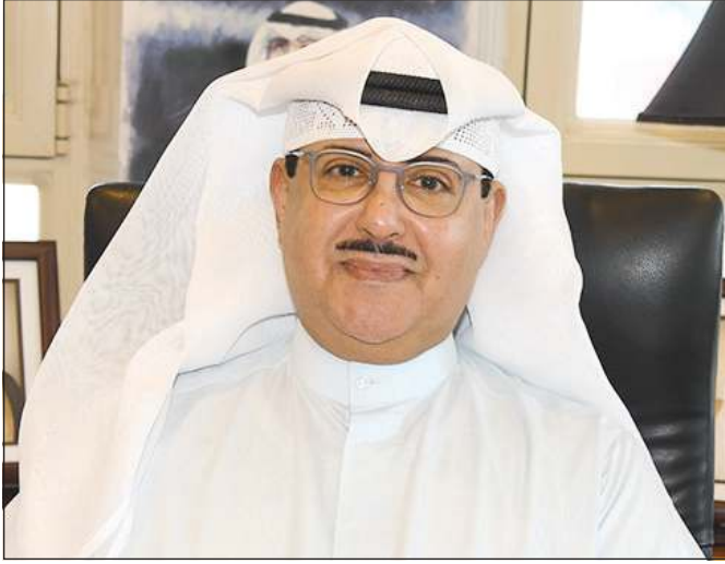
الوكيل المساعد لقطاع الإذاعة الشيخ فهد المبارك الصباح