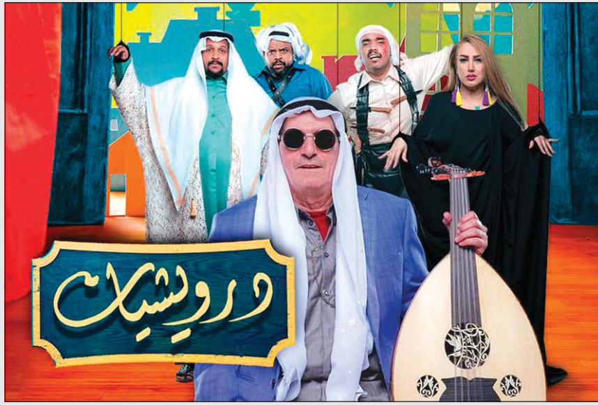
بوستر مسلسل «درويشيات»