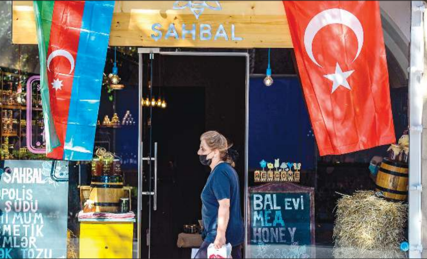
سيدة تسير بجوار محل يرفع علمي أذربيجان وتركيا في باكو

لكلبيجار الأذربيجانية والتي يسيطر عليها انفصاليون. والموقع الأول لإطلاق الصواريخ كان يستهدف مدينتي غنجة ومينغاشيفير الأذربيجانيتين، ومناطق مأهولة أخرى، بحسب الوزارة التي أكدت عدم وجود بنية تحتية مدنية مجاورة. كما اتهمت أذربيجان أرمينيا امس، بمحاولة الهجوم على خطوط أنابيبها الناقلة للغاز والغاز وحذرت من رد «عنيف»، الأمر الذي نفته أرمينيا. وأكدت المتحدثة باسم وزارة الدفاع الأرمينية شوشان ستيبانيان تعرض مواقع عسكرية في المنطقة لقصف. وكتبت في تغريدة أن «الهجوم تم تنفيذه على أساس محض افتراض أن المعدات المستهدفة كانت مستقصف، كما يزعم، جمعيات مدنية أذربيجانية». وأضافت «هذه المزاعم من دون شك، لا تستند إلى أساس، لم يتم إطلاق أي صاروخ أو قذيفة أي مقذوفة في اتجاه أذربيجان».