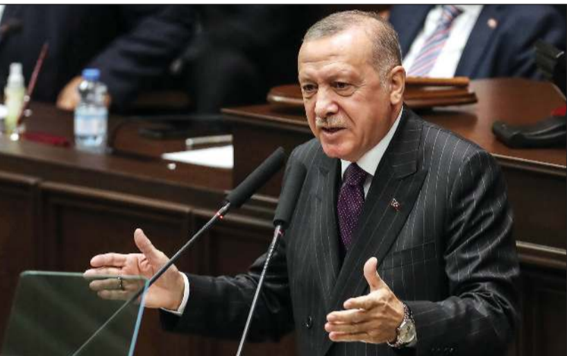
الرئيس التركي رجب طيب أردوغان خلال إلقاء كلمته في البرلمان

بمحاربة انتشار كورونا في روسيا) أن الحزمة الأولى من لقاح مركز «فيكتور»، والتي تضم 60 ألف جرعة، ستنتج في المستقبل القريب. وفي آسيا، توقعت الصين، حيث ظهرت أول إصابة بفيروس كورونا المستجد في أواخر السنة الماضية، انتهاء الفحوصات على كل سكان مدينة تشينغداو اليوم، بعد رصد بؤرة جديدة فيها الأحد الماضي. وأعلنت السلطات الإيرانية أمس فرض قيود مؤقتة على حركة التنقل من وإلى خمس مدن أبرزها طهران، مع تسجيل حصيلة قياسية جديدة للوفيات والإصابات اليومية. وأفاد مدير العلاقات العامة والإعلام في وزارة الصحة كيانوش جهانپور خلال كلمة متلفزة، إن السلطات قررت منع الدخول والخروج من العاصمة، ومدن كرج ومشهد وإصفهان وأرومية. ودخل الإجراء حيز التنفيذ اعتباراً من منتصف الليل الماضي، ويستمر حتى ظهر الأحد، تزامناً مع عطلة لثلاثة أيام والأربعاء، أفادت المحدثه باسم وزارة الصحة سيما سادات لاري عن بلوغ العدد الإجمالي للوفيات 29,349 شخصاً، مع تسجيل 279 وفاة إضافية أمس، في حصيلة يومية قياسية منذ رصد أولى الحالات في فبراير. ووصل إجمالي الإصابات إلى 513,219، مع تسجيل 4830 إصابة، وهي أيضاً حصيلة يومية قياسية.