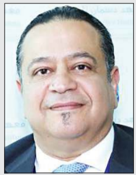
البروفيسور فهد الملا

فهد الملا قائلاً «وتعد هذه النتائج في الوقت الراهن هي النتائج الأولى التي يتم نشرها من معطيات مشروع COVID Human Genetic Effort، وهو مشروع دولي مستمر بالتعاون مع أكثر من 50 مركزاً للتسلسل ومئات المستشفيات حول العالم، ويشترك في تنفيذ الباحثين كازانوفيا وهيلين سو من المعهد الوطني للحساسية والأمراض المعدية. وقد اشتملت الدراسة على مشاركين من جنسيات مختلفة من آسيا وأوروبا وأمريكا اللاتينية والشرق الأوسط بما في ذلك معهد دسمان للسكري، والذي أنشأته مؤسسة الكويت للتقدم العلمي. وقد يكون 19-COVID الآن أكثر مرض معد حاد مفهوماً من حيث وجود تفسير جزئي وجيني لما يقرب من 15% من الحالات الحرجة من حيث المعلومات الجينية المختلفة. وأضاف الملا أنه لا تزال طريقة تأثير فيروس SARS-CoV-2 بشكل