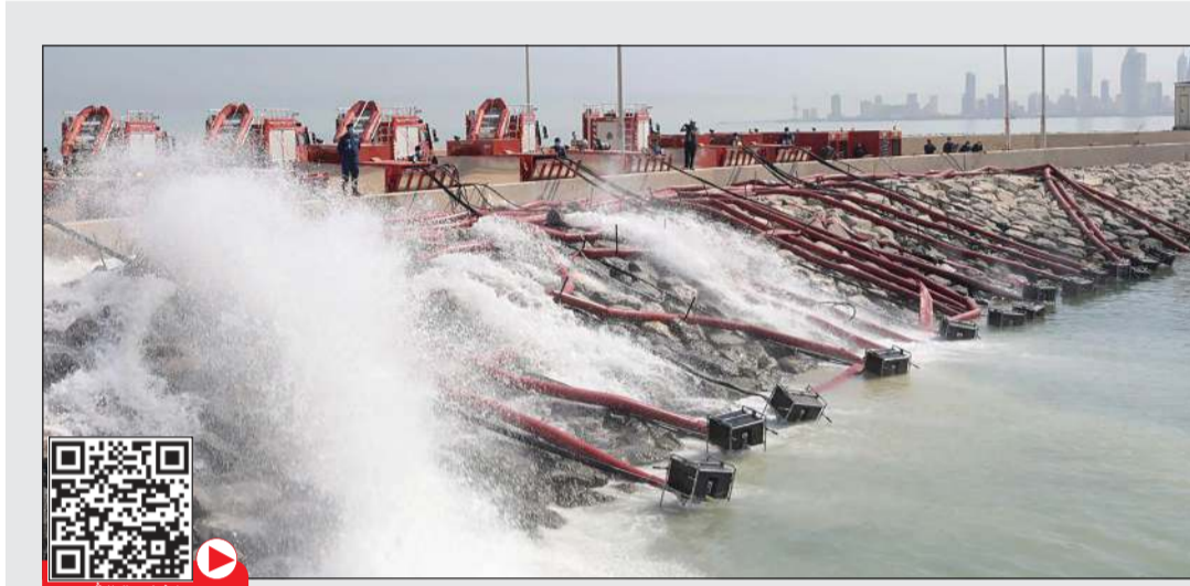
تجربة عملية للمضخات الجديدة في الجزيرة الجنوبية بجسر الشيخ جابر

كشف مصدر نفطي مسؤول لـ «الأنباء»، عن أن شركة نفط الكويت تعمل على قدم وساق للمحافظة على الطاقة ورفع الإنتاجية للغاز الحر من 500 مليون قدم مكعبة يوميا إلى مليار قدم مكعبة، وذلك بتحسين إنتاجية وحدات الإنتاج الجوراسية الثلاث والاستمرار في تنفيذ مشروع المشتاتين الرابعة والخامسة خلال السنة المالية الحالية 2020/2021. وذكر أن الشركة تعمل على تطوير إنتاج النفط والغاز على مختلف الأصعدة، حيث جار العمل حاليا على تطوير مكامن النفط الثقيل في شمال الكويت ليصل الإنتاج إلى 75 ألف برميل يوميا عن طريق الاستثمار في رفع الطاقة الإنتاجية لحقل رتقة (مكمن فارس السفلي) والوصول به إلى طاقة إنتاجية تعادل 60 ألف برميل يوميا من النفط، بالإضافة إلى الاستثمار في تطوير حقل أم نقا والمحافظة على طاقته الإنتاجية التي تعادل 15 ألف برميل من النفط يوميا.