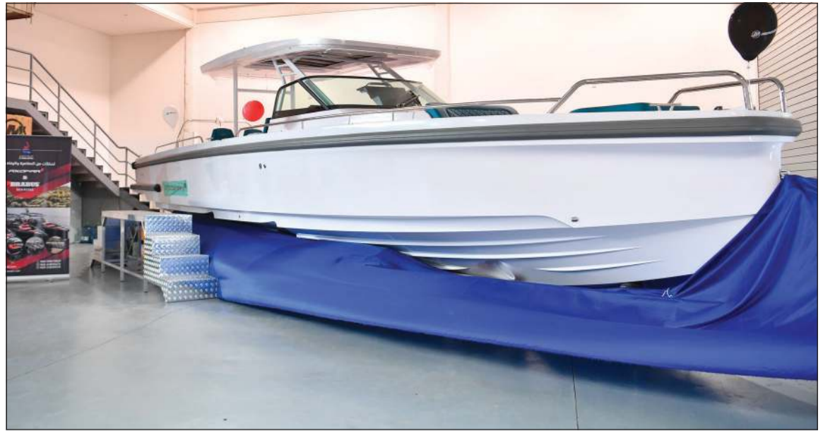
قارب اكسوبار المستوحى من السيارات الرياضية الفاخرة ويتمتع بالعديد من الموصفات الحديثة