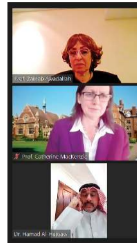
المتحدثون في الجلسة العاشرة