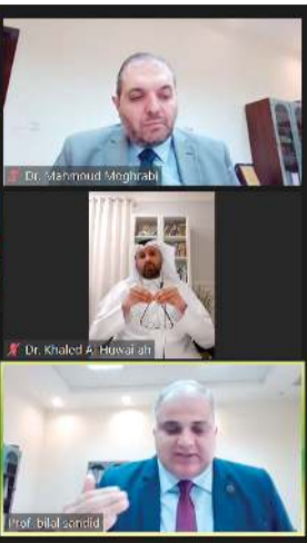
المتحدثون في الجلسة التاسعة

الموازنة بين حق الدولة في الدفع بالنزاع المسلح كقوة دافعة والنزاع لحماية الاستثمارات الأجنبية أثناء النزاعات المسلحة: قراءة في النصوص وممارسات هيئات