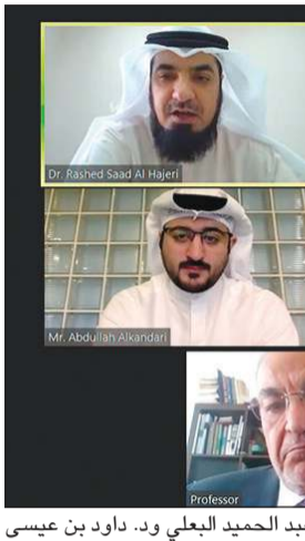
المتحدثون في الجلسة الثانية عشر

شدد المشاركون في المؤتمر السنوي الدولي السابع لكلية القانون على أهمية الموازنة بين الأولويات الوطنية ومصالح المستثمرين الأجانب، بما يحقق الأهداف المشتركة للطرفين، وذلك من خلال أدوات تشريعية وقانونية وإجرائية. وأضافوا أن وجود قضاي وطني مستقل ومتخصص وسريع في التصدي للمنازعات وحلها من شأنه أن يشجع المستثمر المحلي والأجنبي على حد سواء، مؤكداً أن هذا الأمر ممكن التحقق من خلال تنمية مهارات القضاة المحليين وتوفير الإمكانيات اللازمة لهم. وأشار المتحدثون إلى أن استخدام التقنيات الذكية المعاصرة يمكنه أن يساعد في تطوير أدوات فصل المنازعات ومن بينها التحكيم.