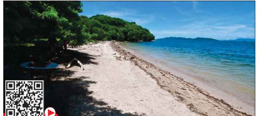
الجزيرة تحولت من سجن إلى جنة سياحية

جزيرة سان لوكاس - أ.ف.ب: تحولت جزيرة سان لوكاس في كوستاريكا من سجن قائم محمل بذكريات مريرة إلى جنة سياحية تتمتع بمتنزه طبيعي وشواطئ خلابة، فعلى بعد مئات الأمتار من ساحل خليج نيكويا في المحيط الهادي، تقع جزيرة سان لوكاس التي عرفت بسجن قاسي نزلؤه ظروف غير إنسانية وتعرضوا للتعذيب أحيانا، من العام 1873 حتى العام 1991 وقت إغلاق هذا المركز.