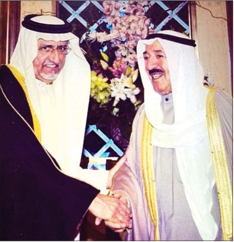
سمو الأمير الراحل الشيخ صباح الأحمد رحمه الله مصافحا عبدالله آل الشيخ في إحدى المناسبات

بقلبه: عبدالله بن محمد آل الشيخ - الرياض