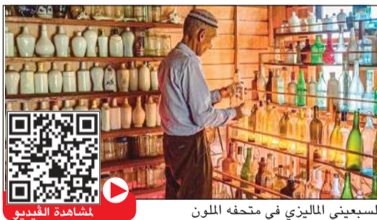
السبعيني الماليزي في متحفه الملون

كامبونغ بيناريك - أ.ف.ب: منذ نحو 15 عاما، يجوب الماليزي في الرابعة والسبعين من العمر شواطئ بلده لجمع الزجاجات التي جرفها البحر وعرضها بالآلاف في متحف ملون من صنعه.