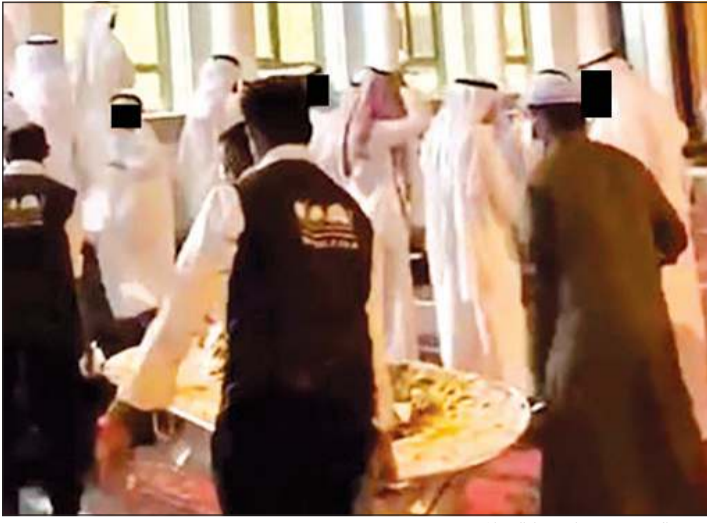
تبدو الولايم في طريقها إلى المدعوين