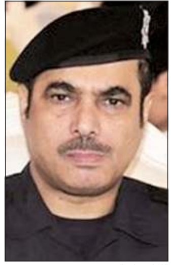
الواء فراج الزعبي

فيها حفلات الأعراس وغيرها، سواء أقيمت في مكان عام أو خاص مثل السكن الخاص أو الديوانيات الخاصة، ومنع إقامة الولايم وحفلات الاستقبال وغيرها لغير أفراد العائلة، ومنع الاستقبالات أو التجمعات في الديوانيات العامة أو الخاصة. وأهاب الكندري بالمواطنين والمقيمين أن يكونوا على قدر المسؤولية الوطنية مع ضرورة الالتزام بالإجراءات الوقائية والصحية التي أوصى بها مجلس الوزراء والتعاون مع رجال الأمن.