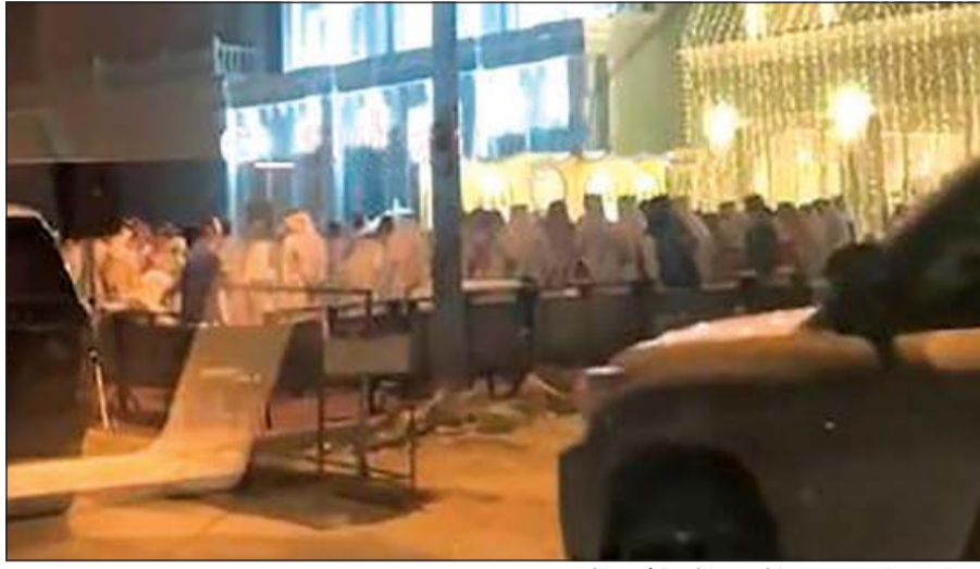
من العرس الذي رصدهت الأجهزة الأمنية أمس الأول