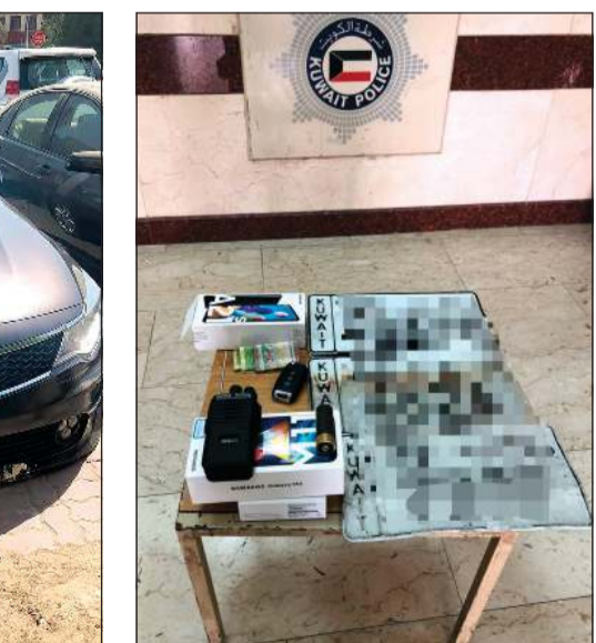
من المسروقات التي تم سلبها من المارة