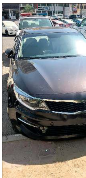
المركبة التي تم استخدامها في عملية السلب