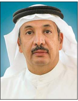
م. وليد الجاسم

بحث المجلس البلدي وزير الدولة لشؤون البلدية م.وليد الجاسم بشأن موافقة مجلس الوزراء على اعتراضه على بندين من قرار المجلس البلدي بشأن تغيير تخصيص مدرسة في الدعية. وقال الجاسم، في كتابه، نحيطكم علما أن مجلس الوزراء قد أصدر قراره رقم 1140 المتخذ باجتماعه رقم 2020/58 المتخذ بتاريخ 2020/9/14 بشأن الموافقة على اعتراض وزير الدولة لشؤون البلدية علي البندين رقمي 2، 4 من قرار المجلس البلدي رقم ب ل ع 21202014284/11 المتخذ باجتماعه رقم 2020/14 المتخذ بتاريخ 2020/3/2 بشأن الموافقة على طلب وزارة المالية تغيير تخصيص الموقع المخصص كمدرسة ابتدائية للبنين، وهي مدرسة ابن سينا الواقعة ضمن منطقة الدعية قطعة 2 من املاك دولة عامة إلى املاك دولة خاصة، وذلك بناء على قرار مجلس الوزراء رقم 496 في اجتماعه رقم 2018/13 المنعقد