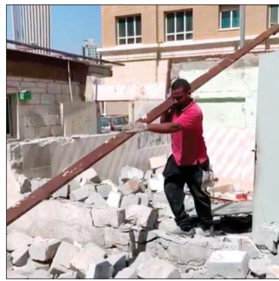
ملاك بعض العقارات قاموا بإزالة المخالفات