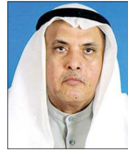
شعر د. يعقوب يوسف الغنيم

عمر الخائفين بالجوهر حتى لم يعد في نواله من خفاء فابو ناصر لنا كان دُخراً وفضي فُشراً علي السناء ولنا الصبر لا سبيل سواه هو فينا باق ليوم اللقاء واتانا نوافث شيخا كريما وامبراً ينسأ عن الكبرياء حاملا في يد شمعار أخيه وبأخري ملوْحاً باللواء طيب يمسلا القلوب ووداداً بابتعاد سفتح عن الخيلاء عاشق للكويت حيا محبا لنراما، يرتاح للانتماء كم به من ملامح الفضل حتى قل أمثالُه عن النظراء نعم الله نعمته هو فيها ومضى في مغزّة وعلاء يا وليا للعهد نهدي التهاني ونسا للإله عسنا الدعاء ان يكون الهناء حولك دوماً لا تری في الحياة وُفق العناء وينسر الطريق حتى تراه واضحاً أخذاً إلى الأهداء بارك الله في جهود تالت منك وازددت دانمأ بالعباء يا كويت العطاء ذمت بلاداً ذات عز في نلكم الأفياء كل أنباك استعدوا ونادوا فلنقدّم للارض خير أداء