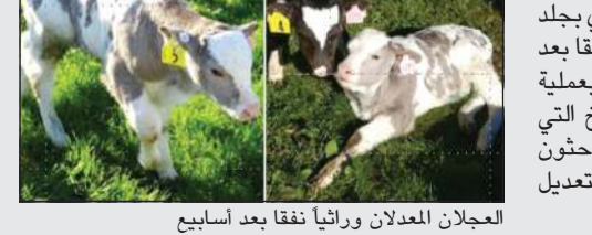
العجلان المعدلان وراثيا نفقا بعد أسابيع

التجربة أنتجت عجلين معدلين وراثيا أي بجلد خال من البقع الداكنة، ولكن العجلين نفقا بعد أسابيع لأسباب يقول العلماء انها لا تتعلق بعملية التعديل الوراثي بل بطريقة الاستنساخ التي اتبعوها في اجراء التعديل. وبهذا ترك الباحثون الباب مفتوحا للاستمرار في عمليات التعديل الوراثي عن غير طريق الاستنساخ.