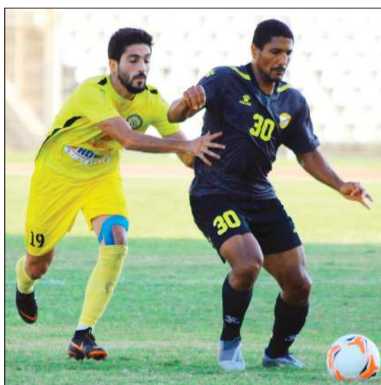
العهد يتطلع إلى تحقيق فوز ثانٍ تواليًا

الانصار افتتاحاً 1-0. وتختتم المرحلة هذا الأحد بثلاث مباريات تجمع النجمة والسلام زغرباً على ملعب أمين عبدالنور البلدي في بحدون، طرابلس والصفاء على ملعب رشيد كرامي البلدي في طرابلس الساعة الثالثة والنصف بعد الظهر، البرج وشباب الساحل على ملعب صيدا البلدي الساعة الرابعة بعد الظهر. وتعتبر المباراة الأخيرة الأقوى في ختام المرحلة، ويطلق عليها «دربي زعامة الضاحية» (الجنوبية لبيروت)، علماً أن الساحل كان تغلب على البرج في دورة محمد عطوي قبل أسبوعين، بينما يتطلع النجمة إلى تحقيق فوز أول على السلام زغرباً الذي يعتمد على لاعبين شباب بعد تغثر النبيني افتتاحاً أمام الصفاء 1-1.