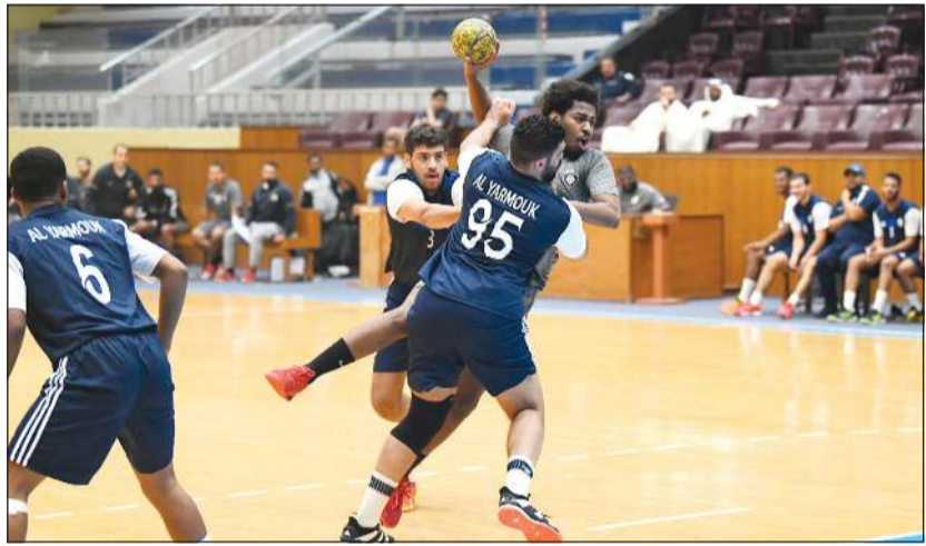
القرين يتطلع لعبور الصليبخات والوصول إلى الممتاز