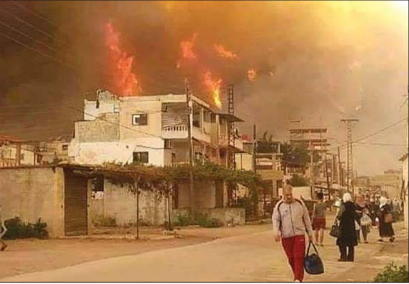
صورة تداولها ناشطون لسكان بلدة أم الطيور يغادرون منازلهم بعد ان اقتربت النيران منها

وكالات: اندلعت حرائق وصفت بـ«الضخمة» والمفاجئة، في وقت مبكر من صباح أمس بعدة مناطق في أرياف حمص واللاذقية وطرطوس المتاخلة، وسط محاولات مراكز الإطفاء التابعة لهذه المناطق السيطرة على الحرائق. وقالت «شبكة أخبار اللاذقية»، عبر صفحتها في «فيسبوك»، إن «موجة حرائق ضخمة، اندلعت بشكل مفاجئ» فجر أمس.