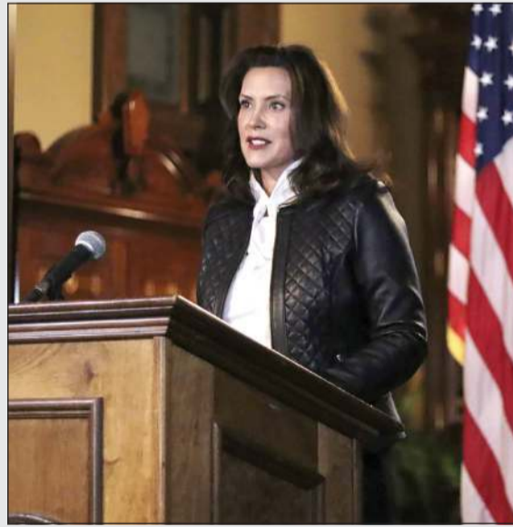
الحاكمة الديموقراطية لولاية ميتشيغان غريتشن ويتمر

تفوق البيض». وأضاف «لا أتسامح مع أي عنف كبير، والدفاع عن كل الأميركيين وحتى الذين يعارضونني أو يهاجمونني هو ما أفعله بصفتي رئيسكم». وكان التحقيق بدأ مطلع العام الجاري عندما علمت الشرطة الفيدرالية «عبر مواقع التواصل الاجتماعي أن مجموعة أفراد تتحدث عن إطاحة بعض مكونات الحكومة وقوات الأمن بالعنف». والمتهمون الستة الذين أوقفوا بينهم ويتمر بأنها «مستبدة» وتمارس «سلطة بلا رقابة». وكانت ويتمر فرضت في منتصف مارس أشد القيود صرامة في البلاد لوقف انتشار وباء كوفيد-19 في ولايتها الواقعة في شمال البلاد والتي كانت واحدة من أكثر الولايات تضررا بالفيروس. وقد أصبحت بذلك هدفا دائما لهجمات ترامب الذي دعا إلى «تحرير ميتشيغان»