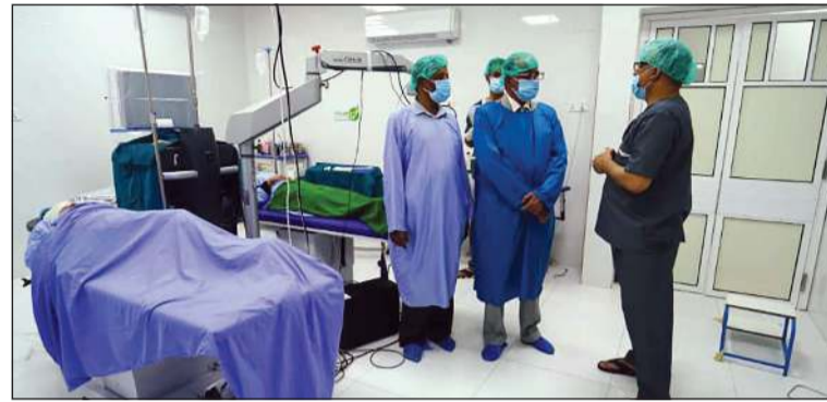
إجراء إحدى العمليات