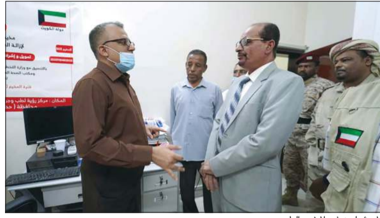
المسؤولون في المخيم الطبي