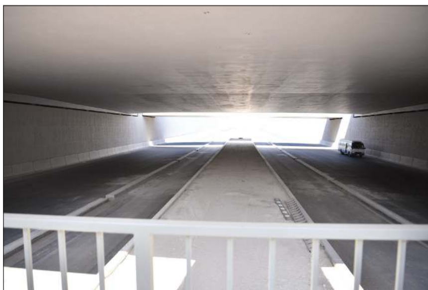
أحد الأنفاق عقب الانتهاء منها

وأشار إلى أن المشروع واجه صعوبات بسبب طبيعة الأرض الصخرية ولكن تم التغلب عليها بالتعاون مع المتعهد ومساعدة وزارة الداخلية في إصدار تصاريح استخدام المتفجرات لتفتيت التربة وهي أيضاً عملية تم استخدامها لأول مرة في