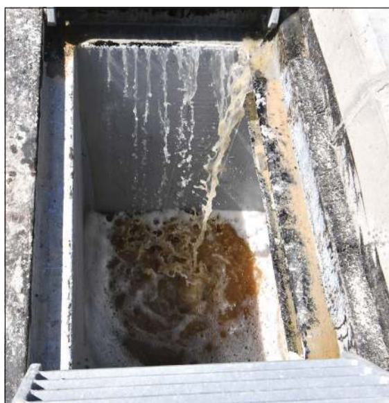
اختبار لجاري تصريف مياه الأمطار بالمشروع