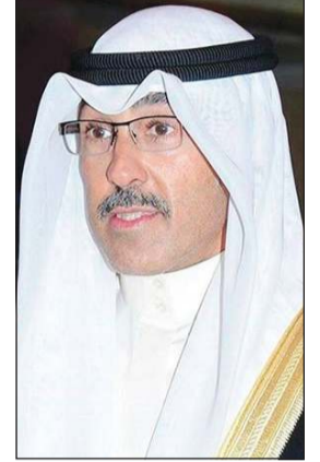
الشيخ فواز الخالد

سندا وعونا لإخوانه أمير القلوب الراحل سمو الشيخ جابر الأحمد، وأمير الإنسانية الراحل وفقيه الكويت والعالم الشيخ صباح الأحمد، طيب الله ثراهما، ومع صاحب السمو الأمير الشيخ نواف الأحمد، حفظه الله ورعاه. وأشار الحجرف إلى أن سمو الشيخ مشعل الأحمد معروف عنه الحزم في اتخاذ القرارات والحرص والعمل وبذل الجهود في تحقيق النجاح والوصول إلى الأهداف المرجوة، إضافة إلى حبه للانضباط والالتزام