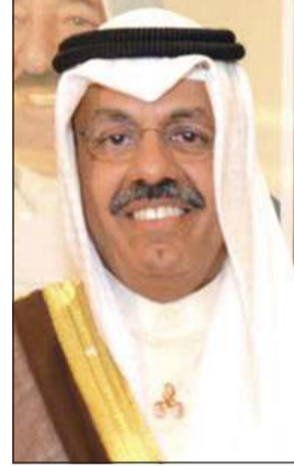
الشيخ أحمد النواف