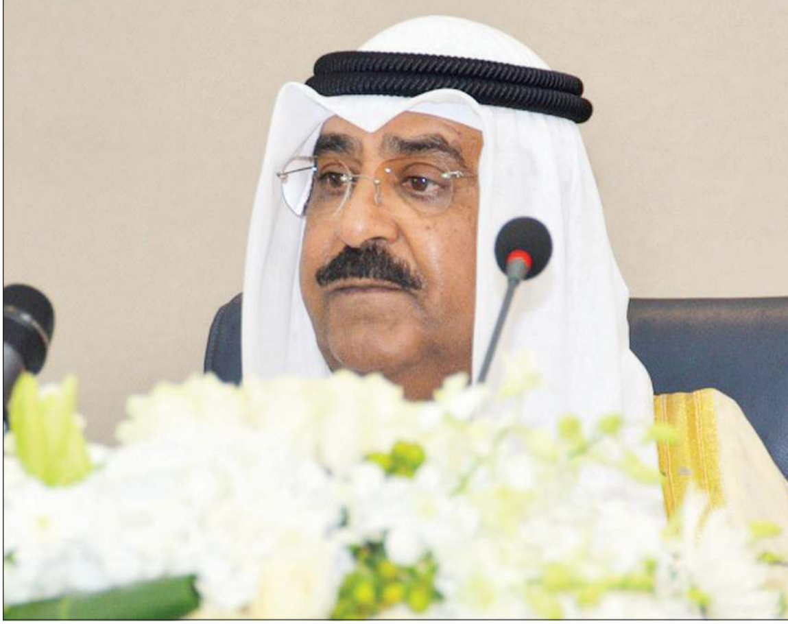
سمو ولي العهد الشيخ مشعل الأحمد