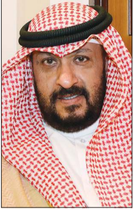
الشيخ طلال الخالد