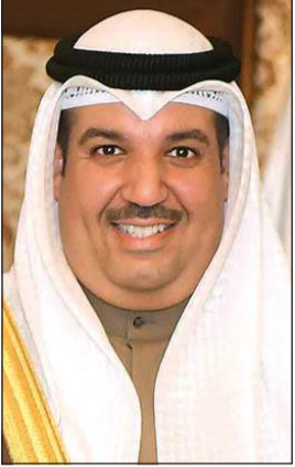
الشيخ مشعل الجابر