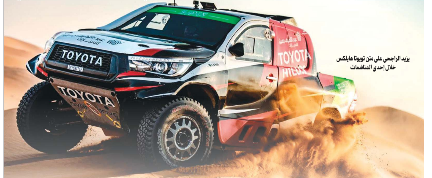
يزيد الراجحي على متن تويوتا هيلوكس خلال إحدى المنافسات