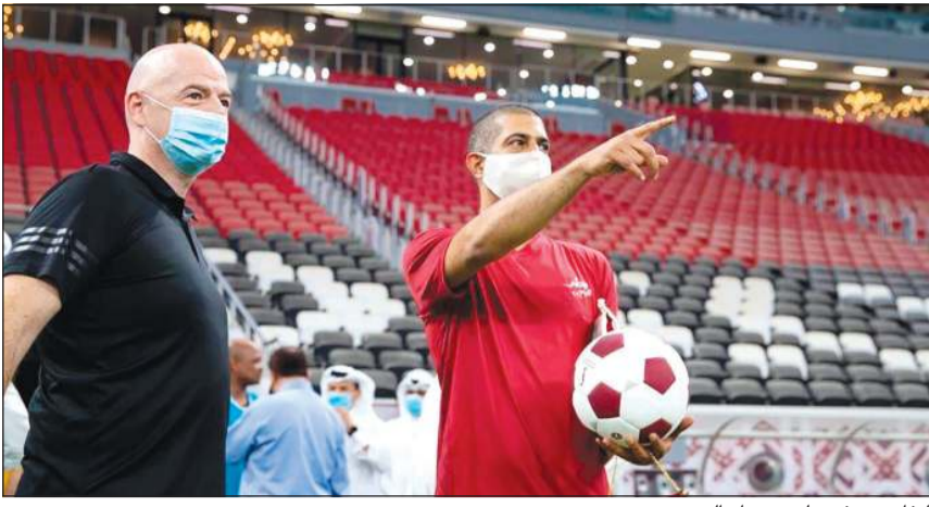
إفانتينو في ملعب ستاد البيت

الدوحة على طاولة استضافة مجموعات شرق آسيا