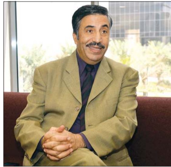
رئيس الجامعة الأمريكية الدولية د. موسى محسن