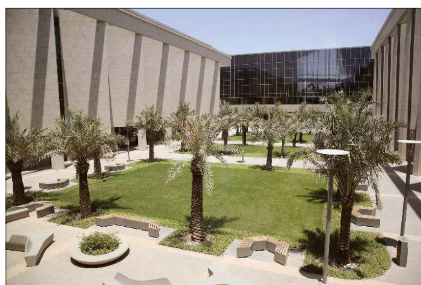
الساحة الخارجية للجامعة الأمريكية الدولية